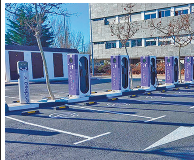
La empresa adjudicataria la explotará durante 15 años

gentedigital.es Toda la actualidad de los distritos de Madrid, en nuestra web