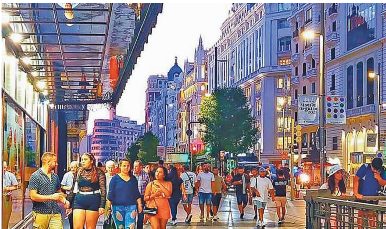
La acera de los impares de Gran Vía registró una mayor afluencia de personas que la de los pares

Los trece espacios serán acondicionados por la adjudicataria del contrato interbloques, que lo realizará de forma voluntaria, ya que está prestación no está incluida en el contrato firmado en 2022. En marzo se finalizará la recuperación de seis de ellos, y el resto, entre octubre de 2024 y marzo de 2025.