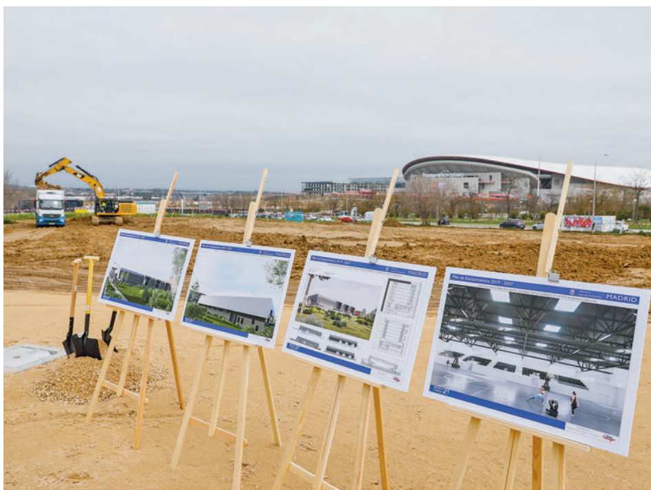
Varios paneles recrean las características del futuro edificio deportivo