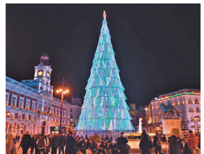
El entorno de la Puerta del Sol

Los sectores más beneficiados fueron los de restauración (28,8% de lo recaudado), alimentación (15,8%) y moda, calzado y complementos (13,4%), alcanzando entre las tres el 58% del gasto total.