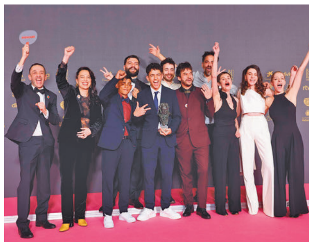
El equipo de 'Aunque es de noche' posa con la estatuilla