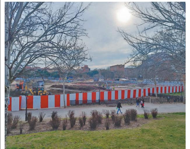
Las obras de ampliación de la Línea 11 de Metro

Mientras, las familias de los escolares del CEIP Perú acusan al Gobierno autonómico de "ignorar" sus peticiones para reforzar la seguridad del alumnado.