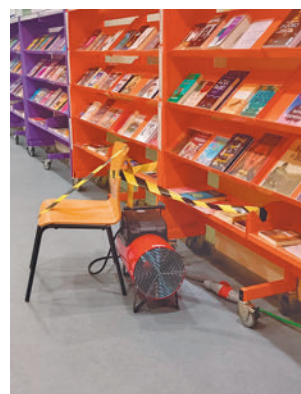
Los calefactores FRAVM

En el primero de los casos, denuncian que aún no está reparada la instalación eléctrica y que se usan cale-