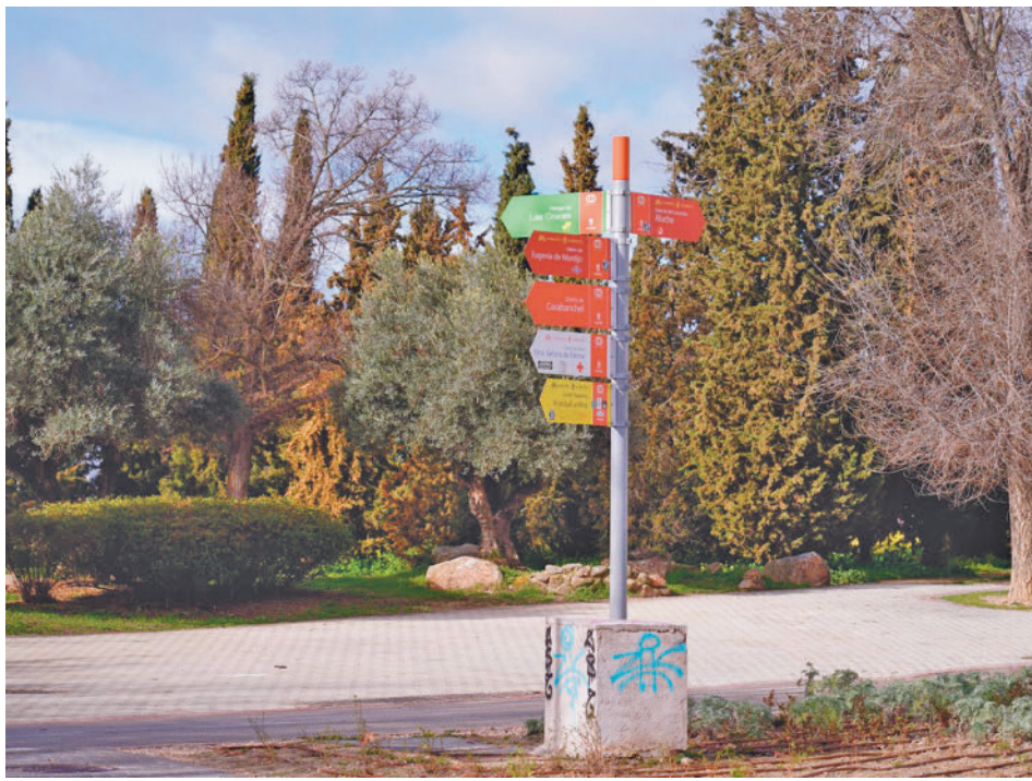
Un poste indica la dirección para acceder a los diferentes espacios de la zona verde