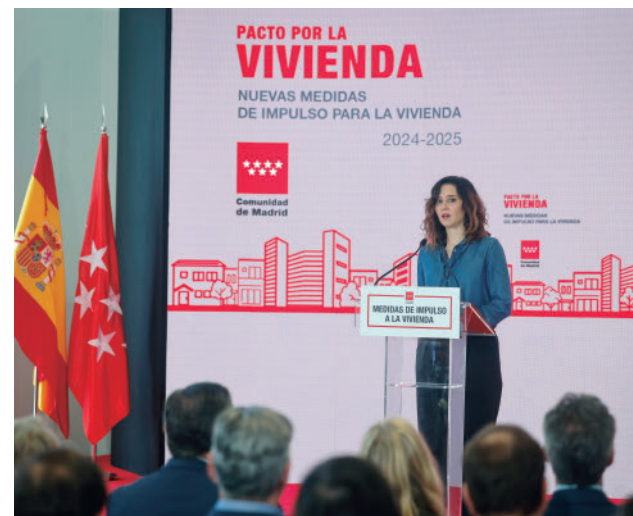
Isabel Díaz Ayuso, durante la presentación del plan