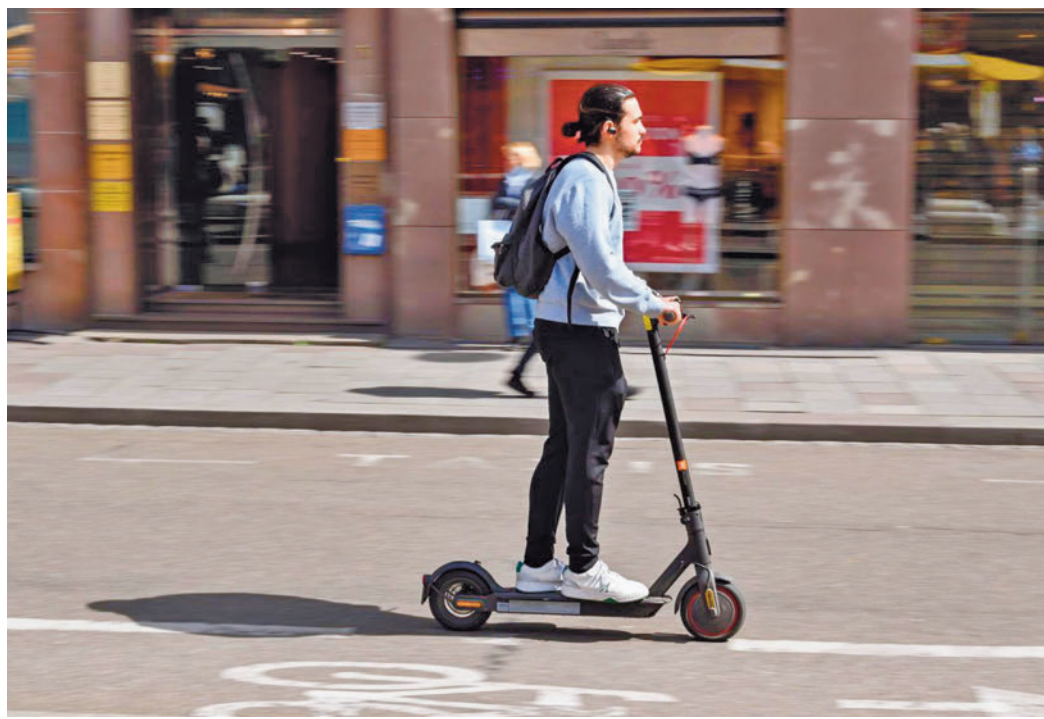
Los accidentes con patinetes eléctricos siguen al alza

Tres de cada cuatro afectados por un accidente eran hombres