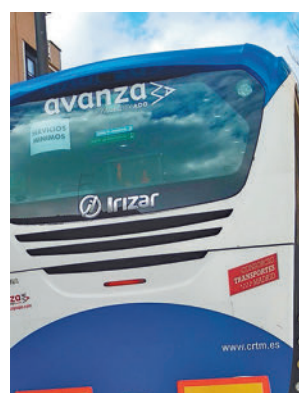
Uno de los autobuses EP

de febrero al no llegar a acuerdos con la empresa adjudicataria de este servicio público, a la que reclamaban diversas mejoras. La compañía, con sede en Getafe, da servicio a todo el Sur de Madrid por lo que, con más o menos rutas, se ven afectados también municipios como Fuen-