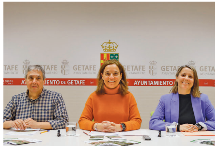
ODS: La alcaldesa, Sara Hernández, el concejal de Transición Ecológica y Medioambiente, Jesús Pérez, y la concejal de Salud, Consumo y Agenda 2030, Alba Leo, han presentado esta semana el nuevo documento. Los tres han señalado la importancia de este plan para cumplir con los Objetivos de Desarrollo Sostenible (ODS).