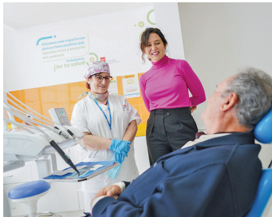
Isabel Díaz Ayuso, durante su visita al centro de salud La Marazuela de Las Rozas

La medida está destinada a los 360.000 ciudadanos que tienen como mínimo 80 años ● Es posible gracias a una inversión del Gobierno regional de 16 millones de € al año