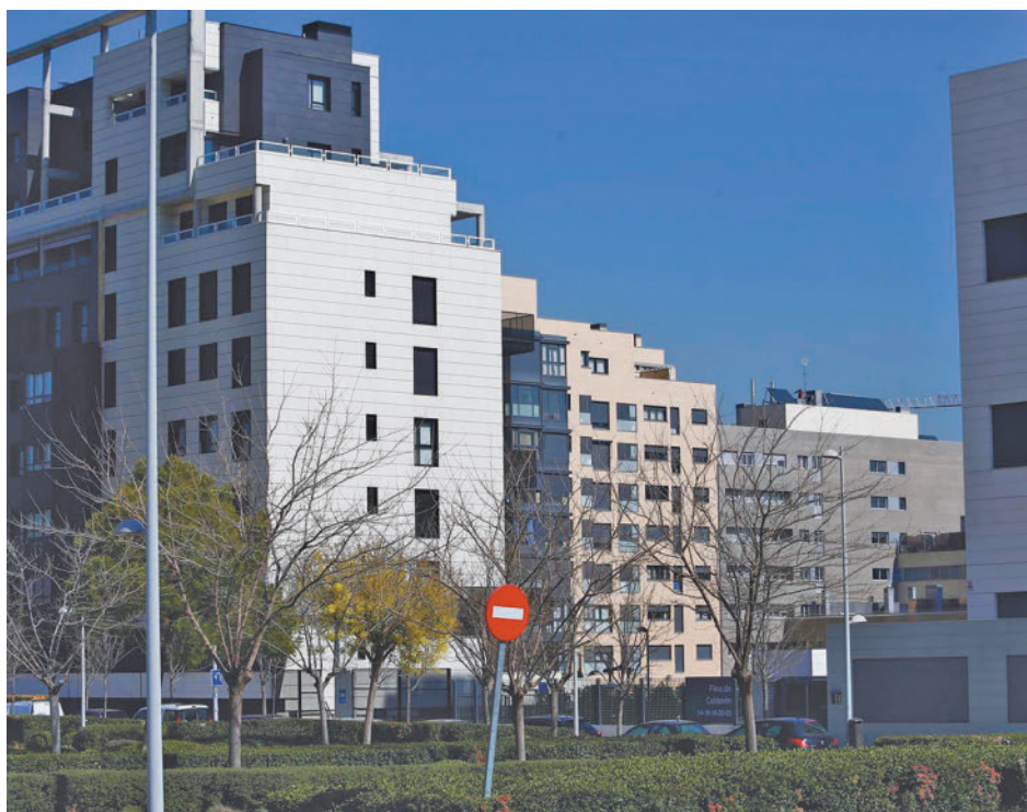
Viviendas en alquiler

En cuanto a las diferencias entre el "precio razonable" y el precio de mercado, Barcelona "se dispara" frente al resto de España, debido a que el alquiler de mercado es 589 euros más caro que el