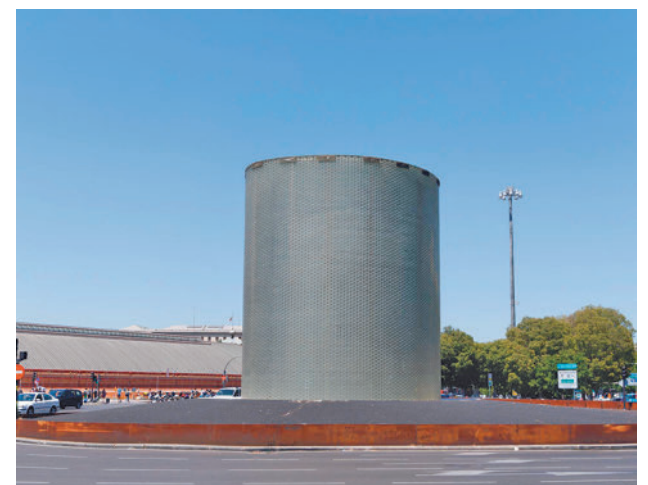
El monumento situado en Atocha, en una imagen de archivo