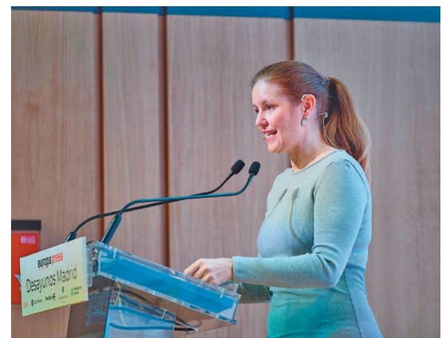
La consejera Ana Dávila

La titular regional de Asuntos Sociales indicó que Madrid es “una región acogedora, abierta, en la que se ha integrado, en menos de 10 años, a más de 1 millón de extranjeros, y trabajamos para atender de la mejor manera a todas las personas afectadas por la grave crisis migratoria”.