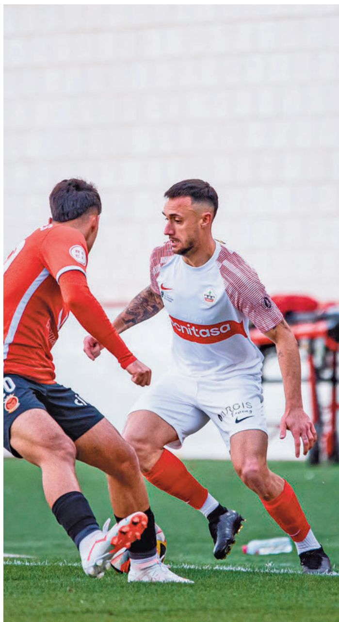
Imagen del partido ante el Montijo UD SANSE

cas y tres salidas a vecinos madrileños: Navalcarnero, Getafe B y Unión Adarve. Como local se verán las caras con otros aspirantes al ascenso como el Numancia y Atlético Paso y tres equipos de la zona media y baja: Villanovense, Mensajero y Badajoz.