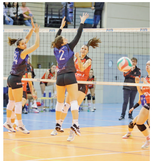
El Feel Alcobendas ya no es colista RFEVB

La jornada 23 de la Liga Femenina Endesa depara un nuevo partido en Magariños para el Movistar Estudiantes (sábado 2, 18 horas). Enfrente estará el Bembibre, colista de la competición.