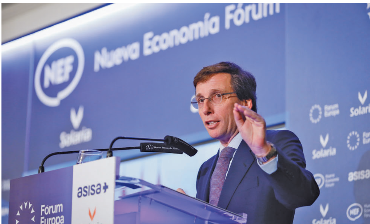
Un momento de la intervención del alcalde, José Luis Martínez-Almeida, en el desayuno de Nueva Economía Fórum

Durante el último cuatrimestre del año, el Ayuntamiento analizará la viabilidad técnica de los proyectos y en el primer trimestre de 2025, se votarán los finalistas. Los que recaben más apoyos, se incluirán en el borrador del Presupuesto General del Ayuntamiento de 2026 y 2027.