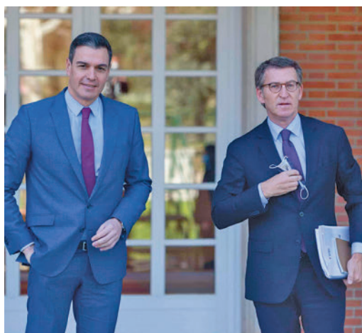
Sánchez y Núñez Feijóo, en una foto de archivo

EL PERIÓDICO GENTE NO SE RESPONSABILIZA NI SE IDENTIFICA CON LAS OPINIONES QUE SUS LECTORES Y COLABORADORES EXPONGAN EN SUS CARTAS Y ARTÍCULOS