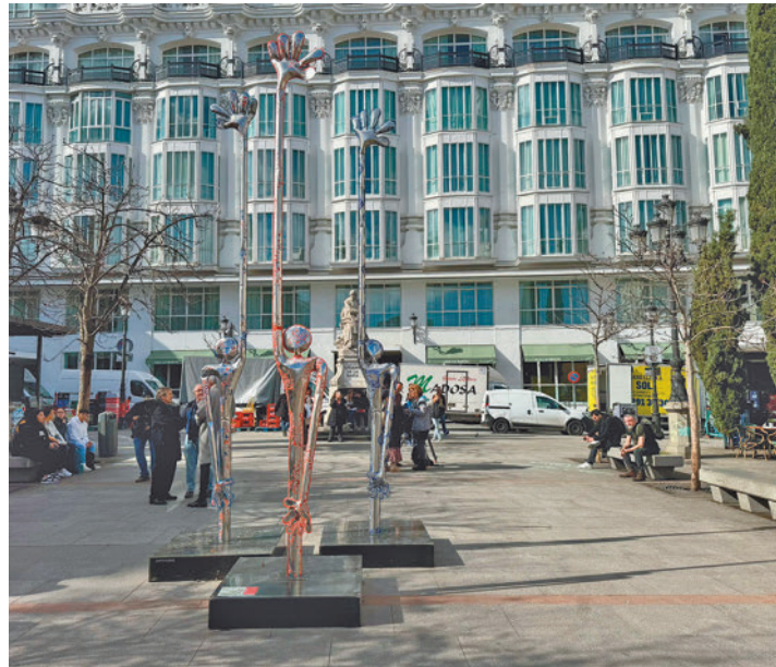
La escultura situada en la Plaza de Santa Ana

La exposición al aire libre del artista Santi Flores se podrá ver en varias áreas peatonales hasta el 16 de abril • La muestra está organizada por la asociación de comerciantes de la zona