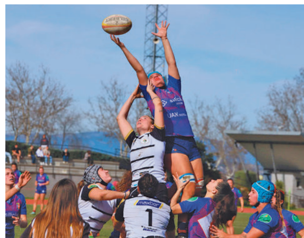
Imagen del último partido del Majadahonda FERUGBY

Después de esa brillante victoria, el Majadahonda regresa este sábado 2 (16 horas) a la competición para visitar el campo del Sant Cugat. El objetivo es llegar a la última jornada de esta segunda fase dependiendo de sí mismo para llegar a los 'play-offs' como primer clasificado y, por tan-