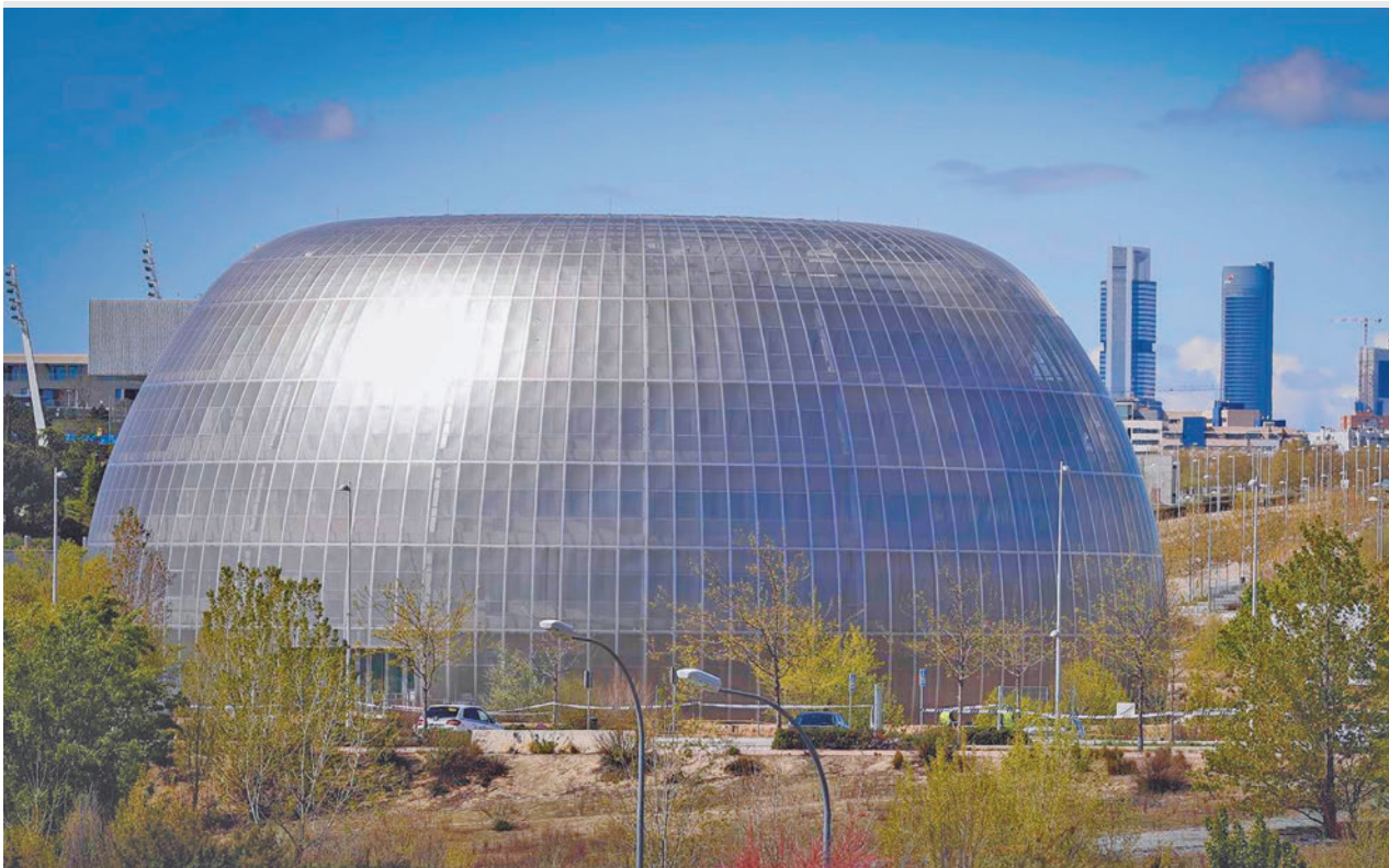
El Instituto de Medicina Legal y Ciencias Forenses es una de las partes que está más avanzada