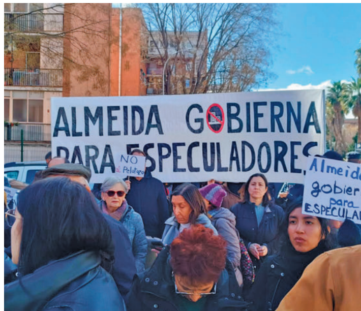
Un momento de la última protesta ciudadana @PELOTAZOERMITA

Unas 200 personas se manifestaron el pasado 24 de febrero ● Volvieron a acusar al Ayuntamiento de Madrid de querer especular en los terrenos del desaparecido centro comercial