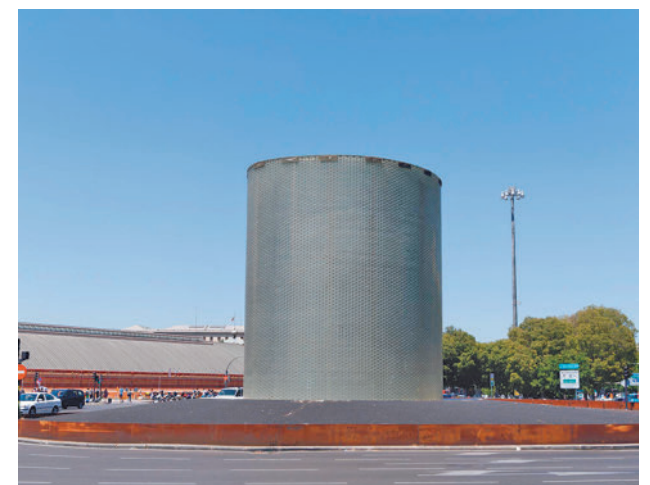
El monumento situado en Atocha, en una imagen de archivo