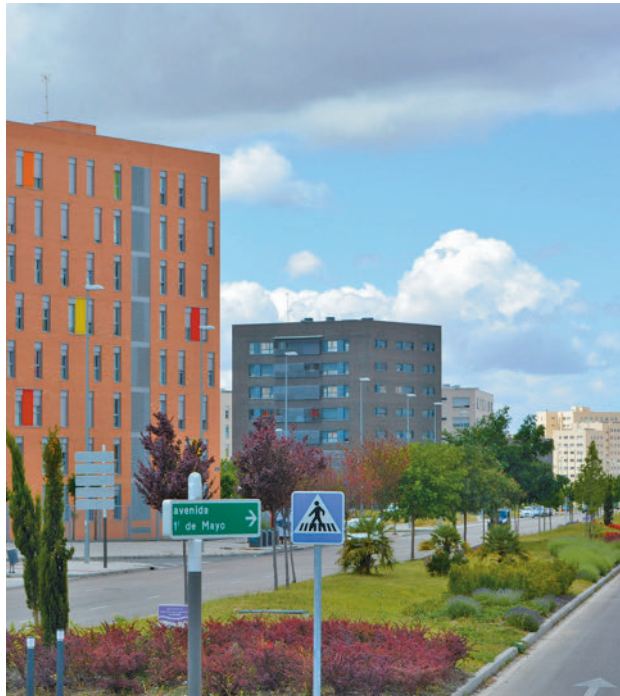
Emgiasa impulsó vivienda pública en el Ensanche Sur

Al menos esa es la intención con la que se ha aprobado esta semana la ejecución del último auto del juez de lo mercantil que desarrolla el concurso de acreedores de Emgiasa, por el que se autoriza a la entidad local a tramitar la adquisición de los activos y pasivos de la empresa. "De esta forma, lograremos recuperar un patrimonio valorado en 14 millones de eu-