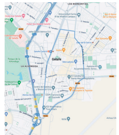
El perímetro de la ZBE: Está formado por la calle Ilustración, la vía Madrid, la avenida Juan de la Cierva, la M-406, la calle Ferrocarril y también el paseo de la Estación (estas calles no entran propiamente en la Zona Bajas Emisiones).