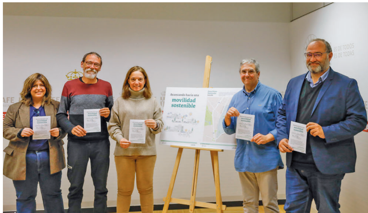
AYUNTAMIENTO DE GETAFE