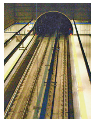
Interior de la Línea 12 EP

El dispositivo tendrá una frecuencia de paso de seis minutos en hora punta y 15 en horario nocturno los días laborales.