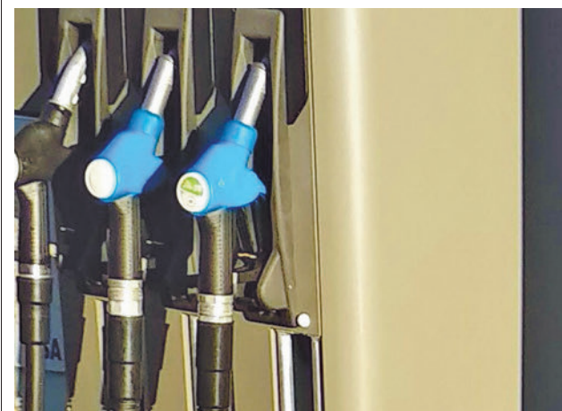
Unos surtidores de gasolinera EP

gentedigital.es Toda la actualidad de Getafe, en nuestra página web