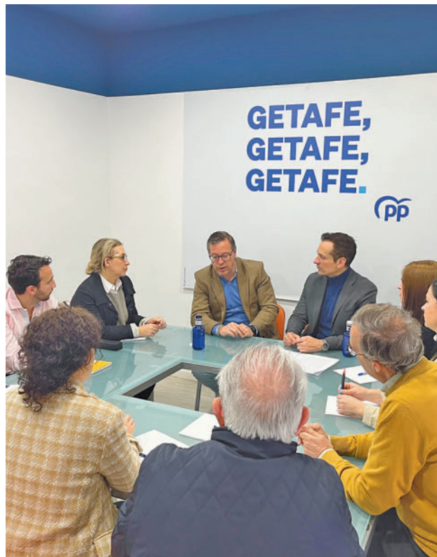
Un momento de la reunión mantenida el lunes en el PP local