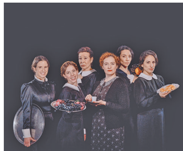
'Tea Rooms' MARCOSGPUNTO

Toda la actualidad de Fuenlabrada, en nuestra página web