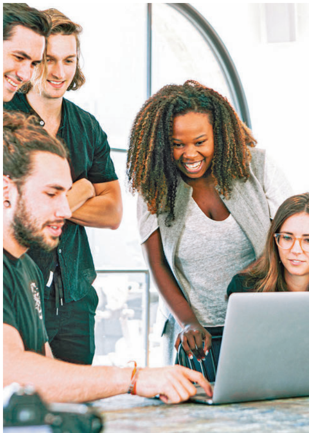
Se ofrece recursos de forma virtual AYTO DE FUENLABRADA

SE INCORPORAN VIDEOPODCAST, CHATBOT Y PÍLDORAS FORMATIVAS