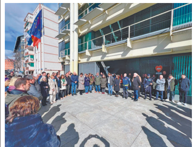
Los vecinos y la Corporación, durante el minuto de silencio

El Servicio de Farmacia Hospitalaria del Hospital Universitario de Fuenlabrada ha recibido un sello de calidad por la información ofrecida al paciente oncológico por parte de la Fundación de Ciencias del Medicamento y Productos Sanitarios (Fundamed) y avalado por la Sociedad Española de Farmacia Hospitalaria en colaboración de la Alianza General de Pacientes. Se trata de un modelo de certificación que ha permitido revisar la gestión de la información dirigida a los pacientes. Se valora la accesibilidad que tienen éstos a los farmacéuticos y las posibilidades de contactar con ellos, así como el uso de nuevas tecnologías y métodos alternativos empleados por la farmacia para comunicarse y realizar el seguimiento de sus pacientes.