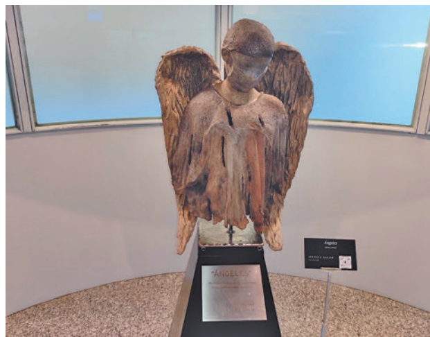
'Ángeles', de Manuel Galán HOSPITAL DE FUENLABRADA

do en varias ocasiones en el Premio del Reina Sofía y cuyas obras han sido expuestas anteriormente en países como Bélgica, Austria y Alemania. La obra, elaborada con hierro y bronce, ubicada en el hall principal de hospital y que se puede visitar de forma gratuita, pretende poner en valor la labor que desempeña el personal que trabaja en los centros sanitarios.