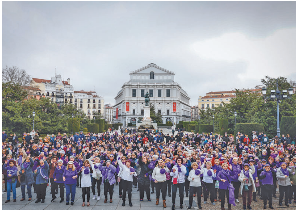
Foto de las cerca de 1.000 usuarias de los centros municipales que participaron en un 'flashmob'

Desde Cibeles destacan la figura de Lomana como primera mujer directora de informativos de una cadena privada y actual presidenta ejecutiva de 50&50 Gender Leadership, una consultora especializada en la promoción real de la igualdad. A través de la misma, desarrolla acciones para implementar la igualdad de oportunida-