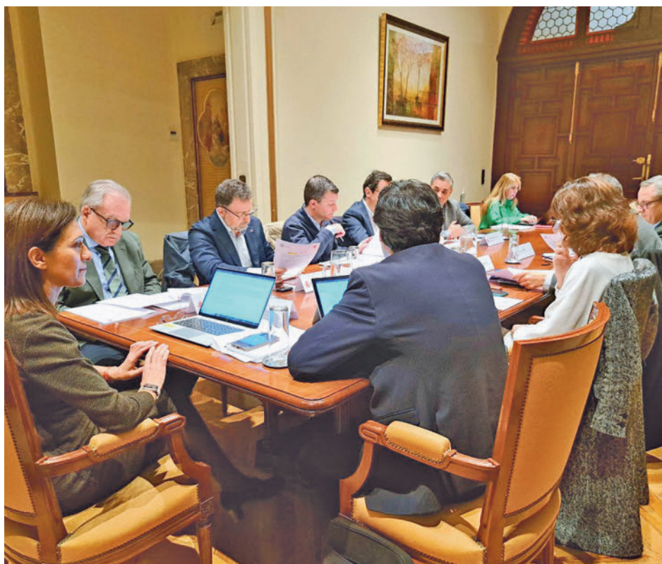
Reunión de todas las partes implicadas

En la reunión se ha convenido, además, la creación de una Mesa Técnica de Empleo a través de la cual se fomen-