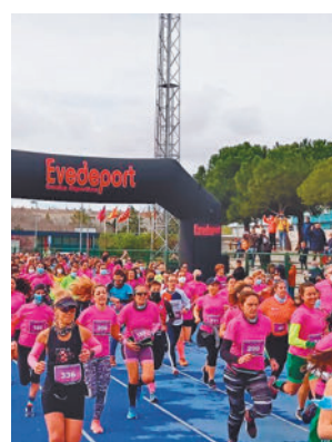
La llegada del pasado año

en el distrito vicalvareño. La carrera popular será el próximo sábado 9 de marzo, a partir de las 10 horas, y contará con un recorrido de seis kilómetros y otro de tres, menos exigente, que se desarrollará por el parque forestal de Vicálvaro, con salida y meta en la pista de atletismo del Cen-