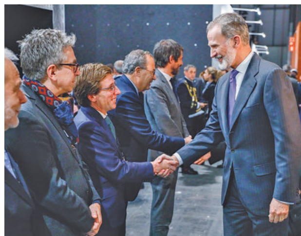
El alcalde saluda a Felipe VI en la inauguración de la feria

El Ayuntamiento ha aprovechado la edición de 2024 para adquirir cuatro nuevas obras de arte para incorporarlas a la colección permanente del Museo de Arte Contemporáneo (MAC) municipal. Se trata de una escultura de Teresa