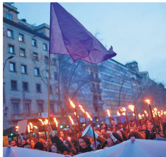
Marcha del 8M en Barcelona

Otro de sus grandes puntos de fricción es su postura frente a la prostitución. Mientras el Movimiento Feminista aboga por su abolición (de hecho este es el principal lema de la manifestación de este viernes en Madrid, que partirá a las 19 horas desde Cibeles), desde la Comisión 8M son más partidarios de su regulación para no dejar desamparadas a las mujeres que viven de ella. La Comisión 8M marchará desde Atocha con el lema 'Patriarcado, Genocidios, Privilegios #SeAcabó' y denunciará también otras cuestiones de actualidad, como el "genocidio" de Gaza.