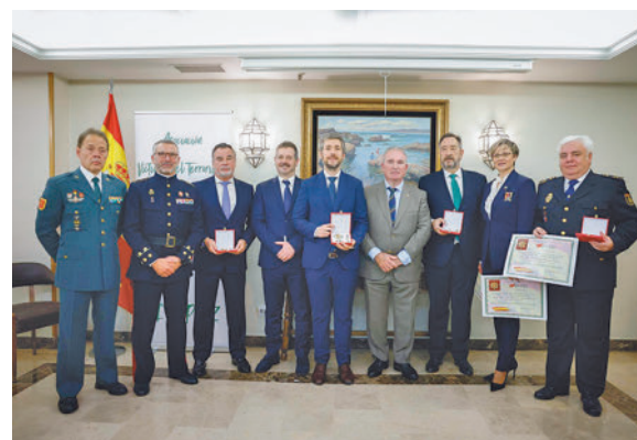
Entrega del reconocimiento

Desde el Ejecutivo madrileño han hecho hincapié, en un comunicado, en que "Madrid fue una de las primeras regiones españolas en aprobar una Ley de Víctimas del Terrorismo y este año destinará 15 millones de euros en ayudas económicas a este colectivo, triplicando la inversión que se hizo en 2023".