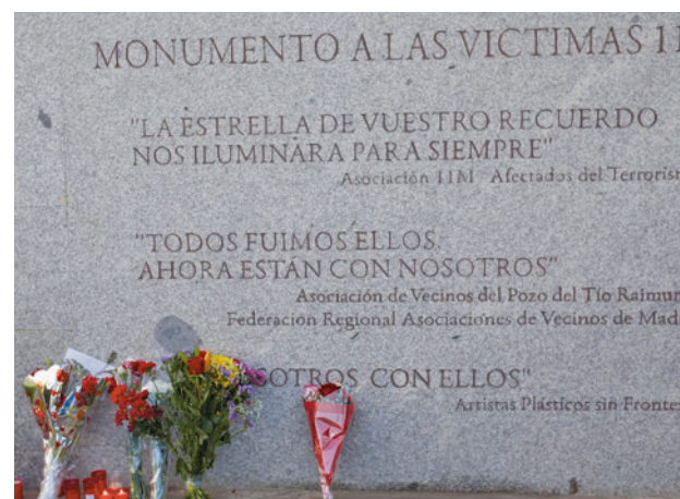
Monumento a las víctimas en El Pozo E.P.

La Comunidad de Madrid inaugurará este domingo 10 un nuevo espacio de homenaje a las víctimas de los atentados del 11M en la estación de Atocha, justo debajo del lugar que ocupaba el monumento conmemorativo que se encontraba en superficie hasta ahora. Las paredes están pintadas de color azul cobalto, el elegido por las Asociaciones de Víctimas para este entorno.