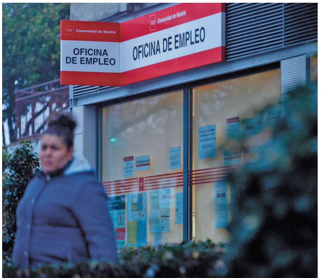
Una mujer frente a una Oficina de Empleo

Según las previsiones del estudio, a partir de datos de la EPA, se estima que para el año 2040 la mitad de las mujeres en activo superaría los 50 años, ya que la población activa femenina envejece a un ritmo de un punto porcentual al año. En términos absolutos, las mujeres activas mayores de 50 años rozan los 4 millones (3.868.900 de mujeres sénior que tienen trabajo o lo buscan, la cifra más alta de toda la serie histórica) frente a las 2.519.000 de hace