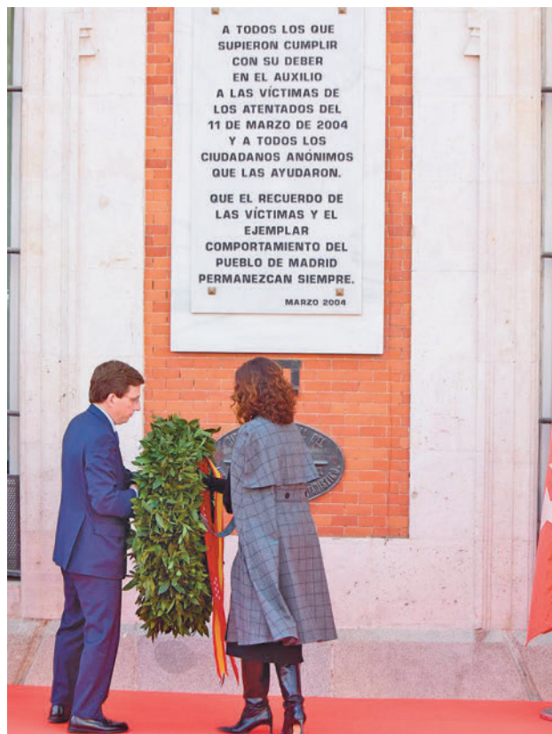
Acto de homenaje del pasado año E.P.

EL ACTO CENTRAL SE HARÁ AL AIRE LIBRE Y ABIERTO A TODOS LOS CIUDADANOS