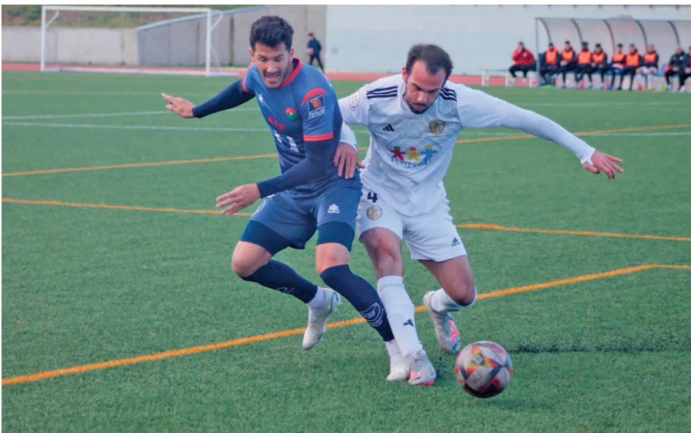
Con su triunfo en Paracuellos, el CD Móstoles URJC acumula 22 jornadas sin conocer la derrota