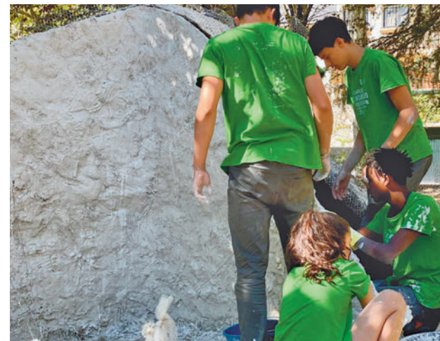
Anterior edición de los Campos de Voluntarios

La cuota del programa, que incluye alojamiento, manutención y actividades, es de 110 o 121 euros, en función de la edad de los participantes, transporte no incluido.