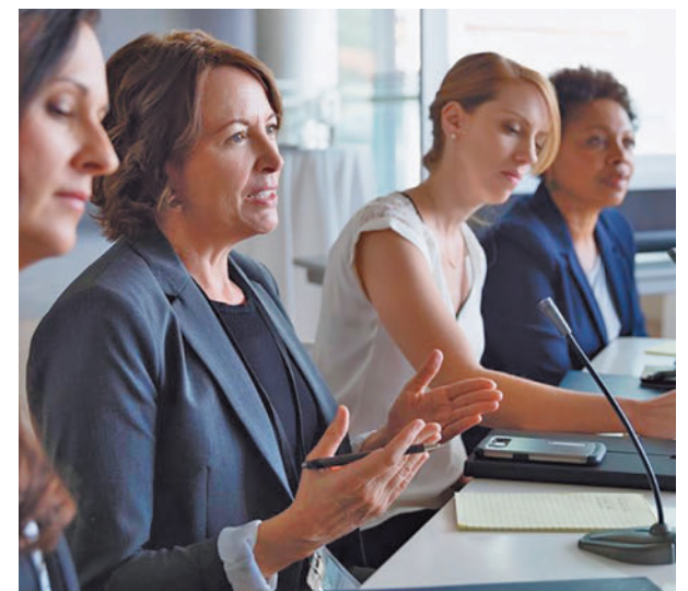
Mujeres en la empresa

Ante esta situación, no es de extrañar que, para los españoles, la flexibilidad horaria y las facilidades para conciliar sean los aspectos más importantes para sentirse a gusto en una compañía (25%). De esta manera, el dinero ya no se postula como uno de los puntos que más interesa a las plantillas.