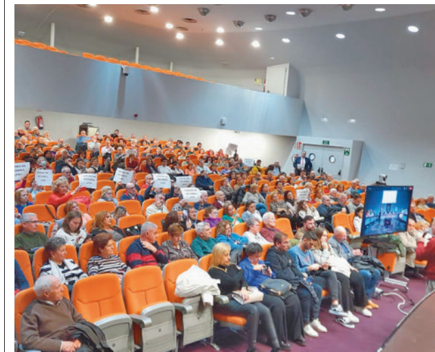
Los asistentes a la sesión plenaria de la semana pasada

La asociación defiende que el Centro de Mayores y de Día se levante en una parcela que se encuentra entre las calles de Suecia, Elba y Helsinki y que actualmente ocupa, en una proporción muy pequeña, la Parroquia de Nuestra Señora de las Rosas. En este barrio viven más de 5.000 personas de 65 años y más de 7.000 supera los 60.