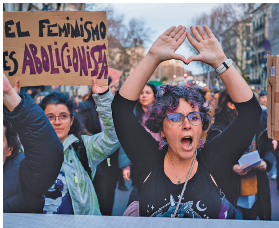
Marcha organizada por el Movimiento Feminista de Madrid en 2023 E. P.