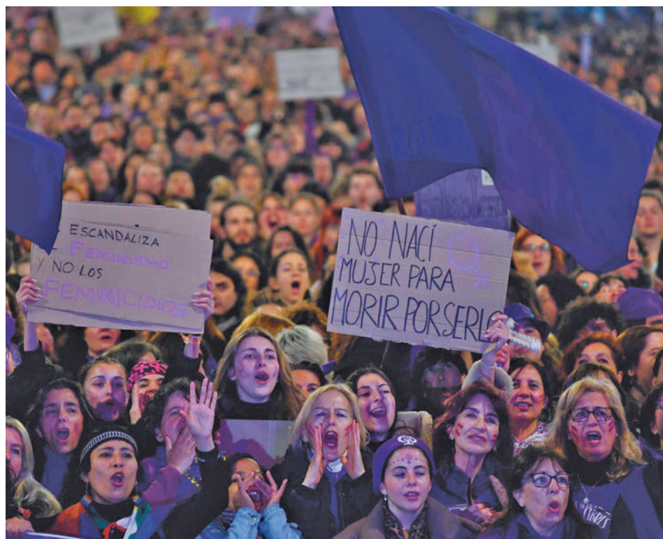
Manifestación de la Comisión 8M del pasado año