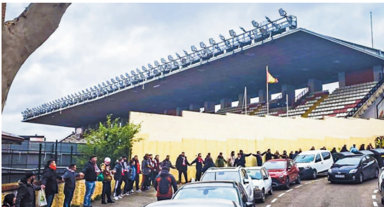
Los seguidores rayistas, agarrados de la mano, rodearon el estadio vallecano ADRV