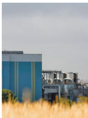
La planta de Las Lomas

(PTV) con un objetivo preventivo para el medio ambiente y la población del entorno. Su duración será de tres años y el gasto plurianual, de 1,7 millones de euros (1.726.843), "para lograr una mayor exhaustividad en el control ambiental de gases que afectan a la calidad del