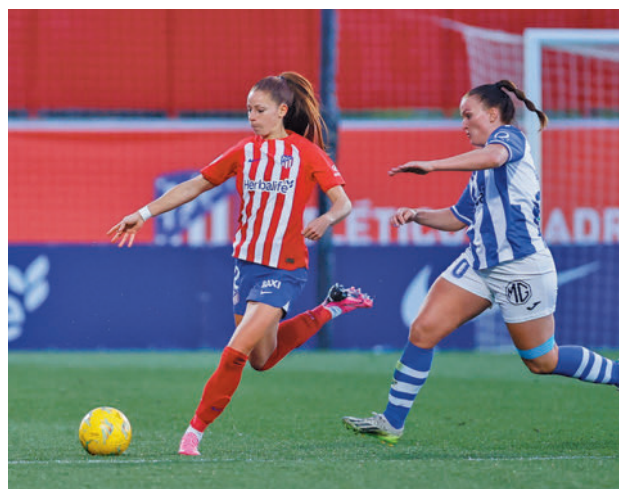
Triunfo rojiblanco ante el Huelva

do méritos, las rojiblancas visitan este domingo (12 horas) a un Granada que es tercero por la cola, mientras que el Madrid CFF jugará 24 horas antes en el campo del Villarreal. Por su parte, el Real Madrid defiende su segunda plaza en Valdebebas (sábado, 20 horas) ante el Eibar.