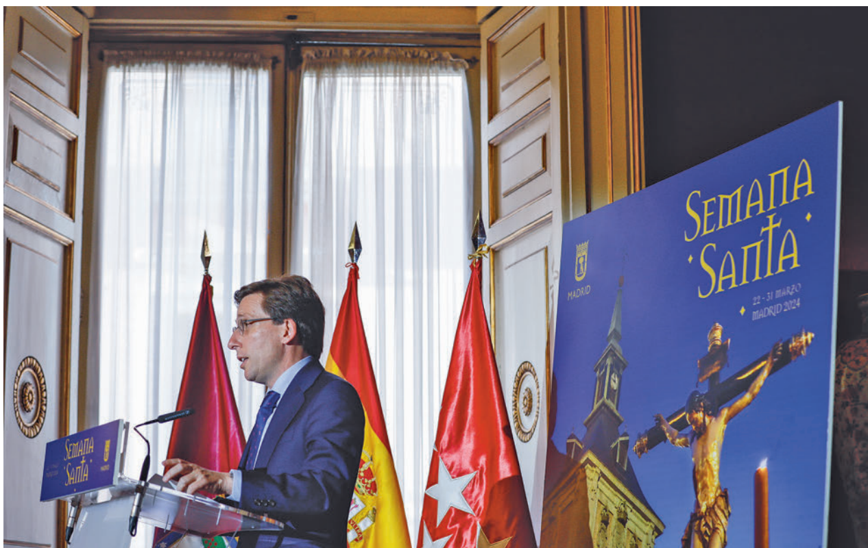
Un momento de la intervención del alcalde en la presentación de la programación cultural de Semana Santa