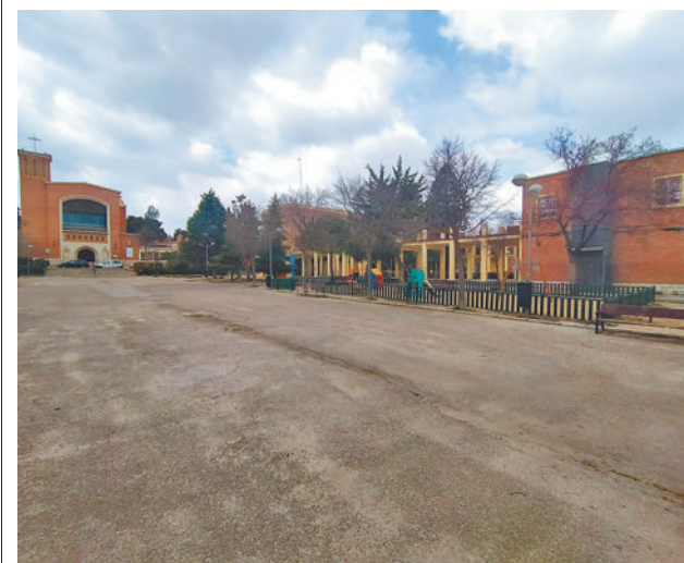
Estado actual de la zona de actuación

Toda la actualidad de los distritos de Madrid, en nuestra web