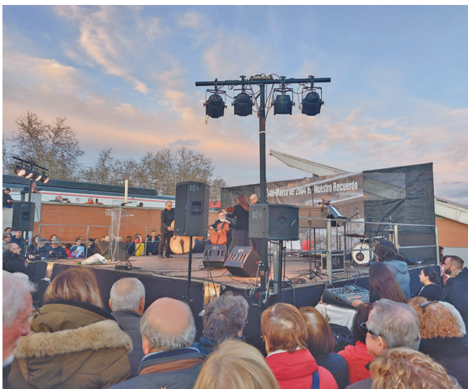
El acto 'in memoriam' celebrado en la estación de El Pozo del Tío Raimundo

Para mitigar el efecto 'isla de calor', además de la citada fuente, se aumentará la superficie de arbustos y árboles y se instalará una pavimentación 100% permeable.