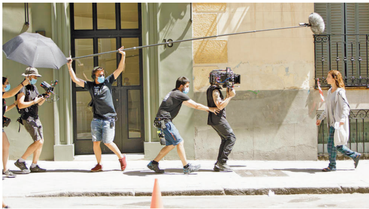
Rodaje de un proyecto audiovisual en la Comunidad de Madrid