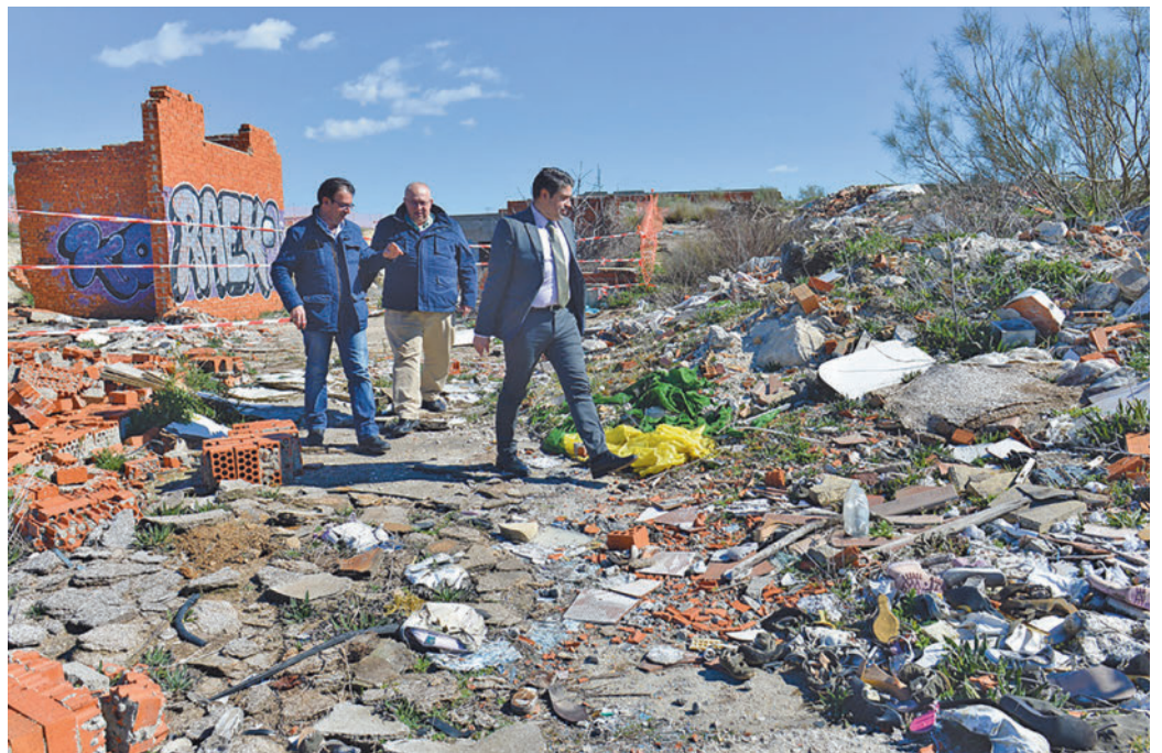
El alcalde de Valdemoro visitó la zona afectada

Una vez retirados los residuos, la empresa realizará un análisis pormenorizado del suelo y procederá a la nivelación del terreno en aquellas zonas que hayan podido quedar irregulares y llevará a cabo la restauración de la cubierta vegetal en aquellas otras que sea preciso, con vistas a evitar la erosión de estos suelos.