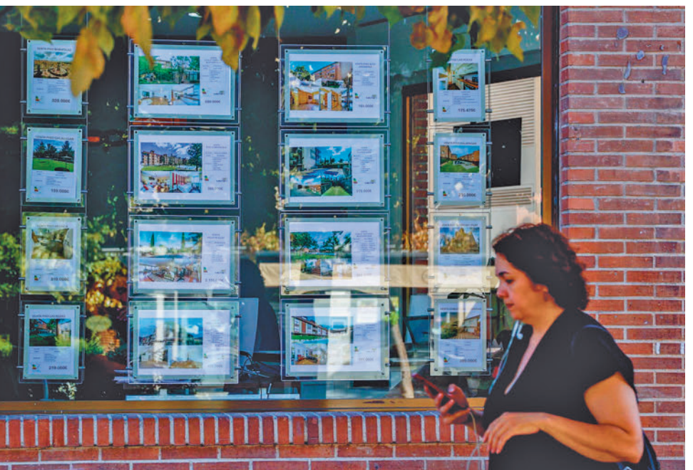
Una mujer pasa frente a una inmobiliaria

En el otro lado del mercado, el de los propietarios, el predominio corresponde a los hombres, con un 53% de presencia frente a un 47% de mu-