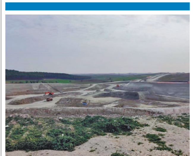
Vertedero de Pinto

Antes de esta innovación asistencial, los usuarios del Hospital Infanta Cristina candidatos a este tipo de cirugía eran derivados a otro centro de referencia. De ahí que la incorporación de estas nuevas técnicas permita, además, acortar los tiempos de espera, con el consiguiente efecto sobre la salud y el bienestar de estos pacientes.