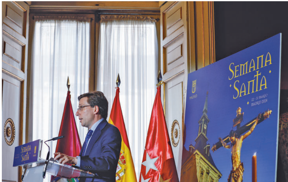
Intervención del alcalde en la presentación de la programación de Semana Santa

Esta será una de las principales novedades de la celebración de esta festividad en la capital que anunció el alcalde, José Luis Martínez-Almeida, en la presentación de la