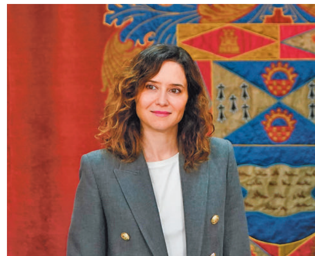
Díaz Ayuso, tras el Consejo de Gobierno