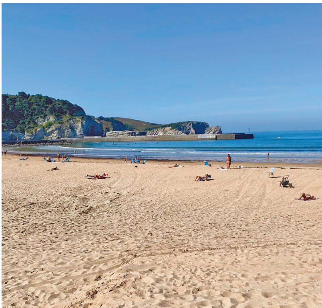
Las playas son uno de los destinos de esta Semana Santa

En 2023, visitaron España un total 10,8 millones de turistas alemanes, un 10,6% más que en 2022, y en el primer mes de este 2024 llegaron 551.305 visitantes germanos, un 14,9% más, cuyo gasto fue un 25,5% superior.