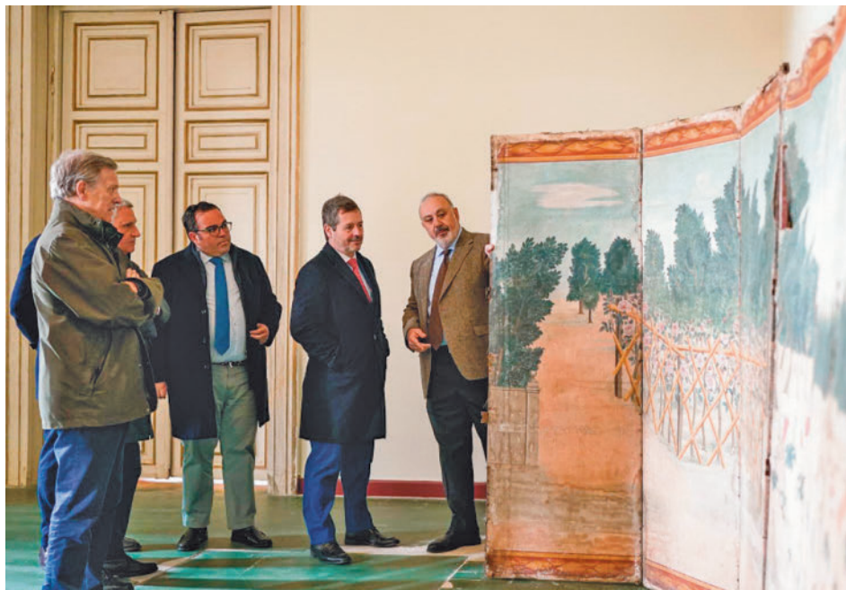
Visita al Palacio del Infante Don Luis

Las dependencias que se van a renovar incluyen un espacio de doble altura abovedado, donde se recuperarán sus acabados interiores y se colocará un pavimento del que ahora carece. También se cambiarán las carpinterías de madera siguiendo el modelo original del siglo XVIII y