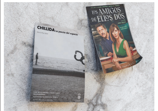
El Ayuntamiento ha editado un folleto de las conferencias

Consistorio; y participar en futuros proyectos innovadores y de movilidad puestos en marcha desde el Ayuntamiento, entre otros.