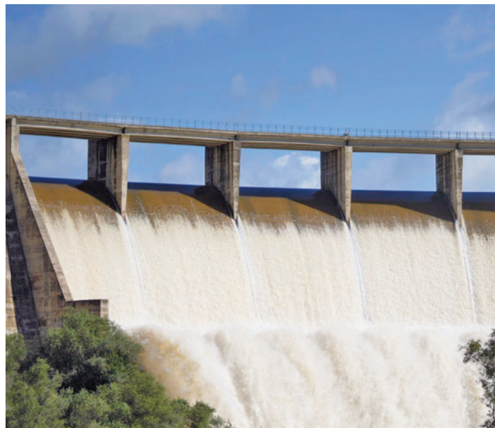
Algunos embalses están soltando agua EUROPA PRESS

La reserva hídrica se ha incrementado en más de cinco puntos en solo una semana ● Ahora está once puntos por encima de la que había hace un año, pero por debajo de la media