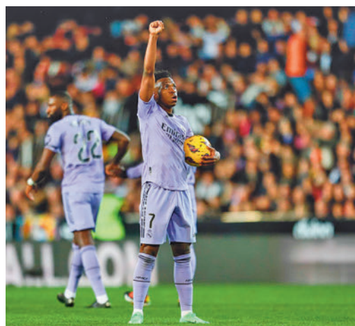
Vinícius Junior celebrando un gol en Mestalla

EL PERIÓDICO GENTE NO SE RESPONSABILIZA NI SE IDENTIFICA CON LAS OPINIONES QUE SUS LECTORES Y COLABORADORES EXPONGAN EN SUS CARTAS Y ARTÍCULOS