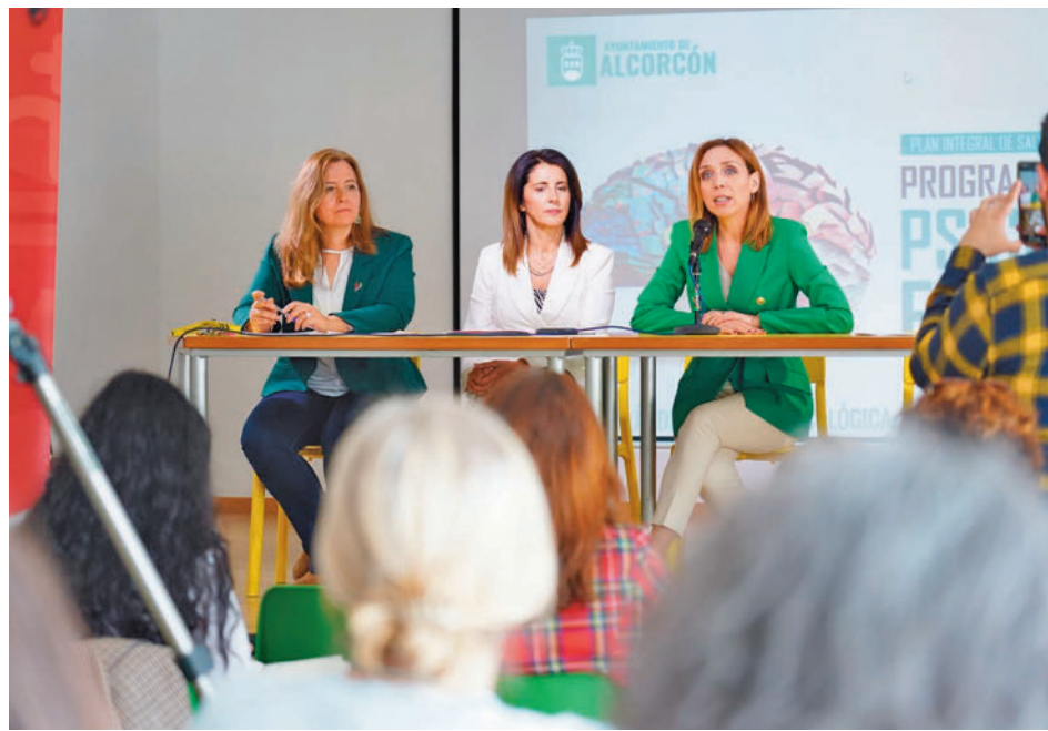
El Programa de Atención Psicológica Educativa tiene "carácter público cien por cien"

Se trata de una iniciativa municipal "pionera" para prevenir y evitar el abandono escolar mediante la intervención psicológica y psicopedagógica. El Programa de Atención Psicológica Educativa tiene "carácter público cien por cien" y se desarrollará directamente por funcionarias, "sin incrementar así la partida presupuestaria" mediante una reestructuración