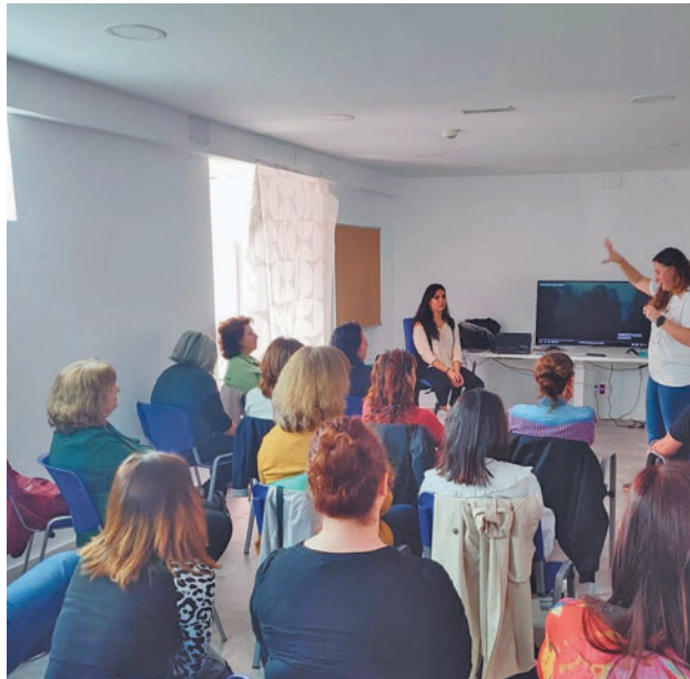
Los vecinos acudirán a las clases y taller de salud

Se trata de una extensa programación que arranca este viernes con la instalación de mesas informativas de la Red de Entidades, que se situarán en la calle Los Cantos (frente al polideportivo municipal) para, posterior-