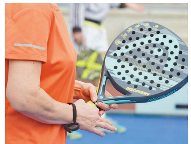
El objetivo es promocionar el deporte base