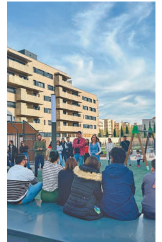
La reunión con los vecinos

La alcaldesa, Candelaria Testa, ha anunciado que solicitará una reunión urgente con el consejero de Vivienda, Transportes e Infraestructuras de la Comunidad de Madrid, Jorge Rodrigo, "para intentar dar amparo" a las familias acogidas a la primera promoción del Plan Vive en la localidad. "Se trata de viviendas mal acabadas y con condiciones abusivas", ha dicho, al tiempo que apunta a que "son los propios vecinos quienes nos han trasladado esta situación". El Ayuntamiento celebró una asamblea con los afectados el pasado 5 de abril