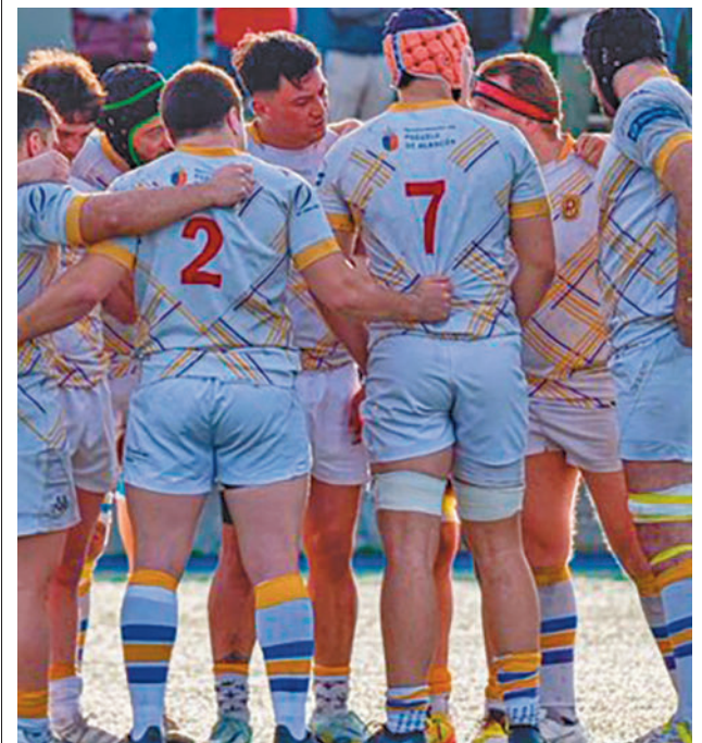
Última jornada de la fase regular

En el Grupo A, el Silicius Alcobendas Rugby llega a la última jornada pleno de moral después de un triunfo de prestigio ante el VRAC Quesos Entrepinares. En el caso de ganar este domingo (12:30) en Las Terrazas al Burgos puede asaltar la cuarta plaza.