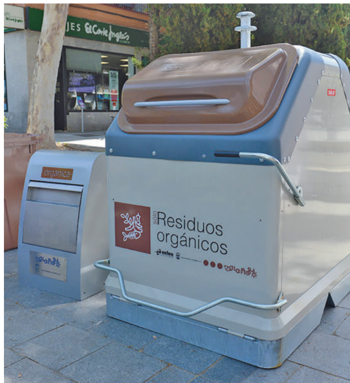
Uno de los nuevos contenedores

Con objeto de informar a la población, el Ayuntamiento ha previsto una campaña compuesta por diversas acciones que se irá desarrollando a lo largo de los meses que dure la implantación del servicio. También ha habilitado una página web específica, www.elfuturodelmarron.com , en la que se explica el procedimiento de reciclado, el impacto y los bene-