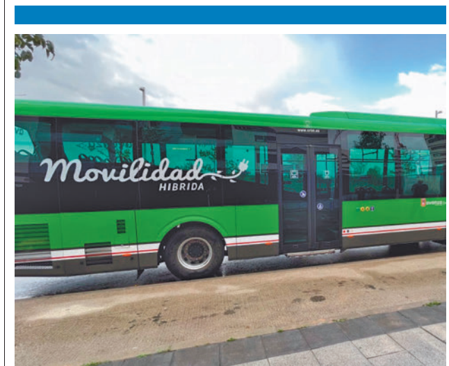
Autobús interurbano en Pinto