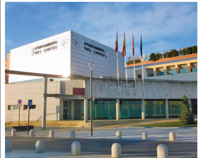
Ayuntamiento de Tres Cantos

Según el alcalde, Jesús Moreno "será la hoja de ruta del desarrollo sostenible del municipio, que orientará las decisiones del equipo de Gobierno en los ámbitos de la ordenación territorial de una manera global, para una población más habitable, inclusiva, sostenible y saludable".