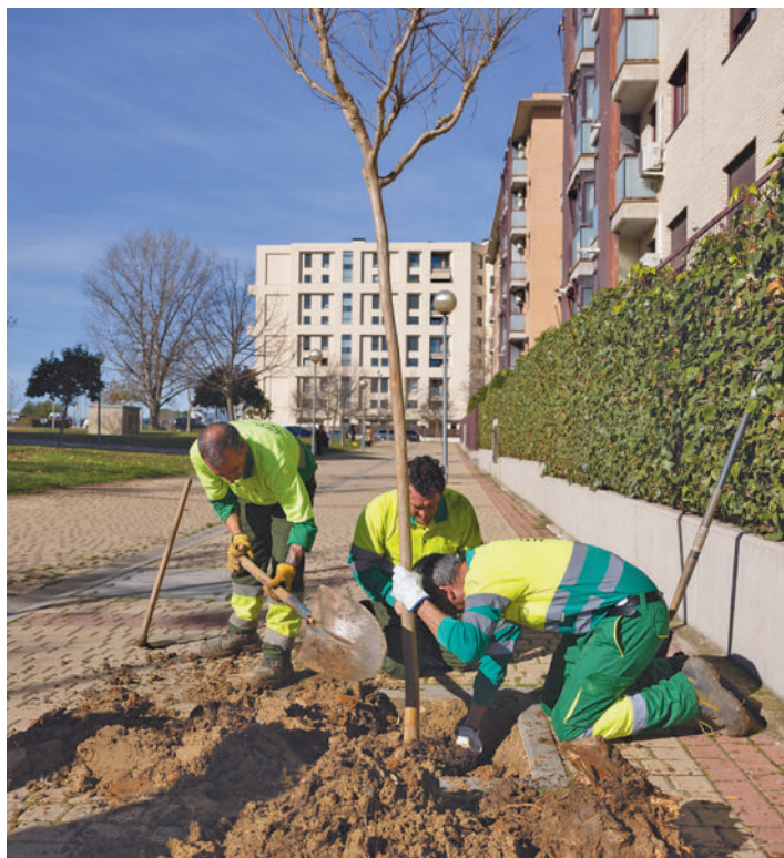
Labores de plantación en la calle del Fuego

También hay que destacar la reposición y saneamiento del arbolado en la