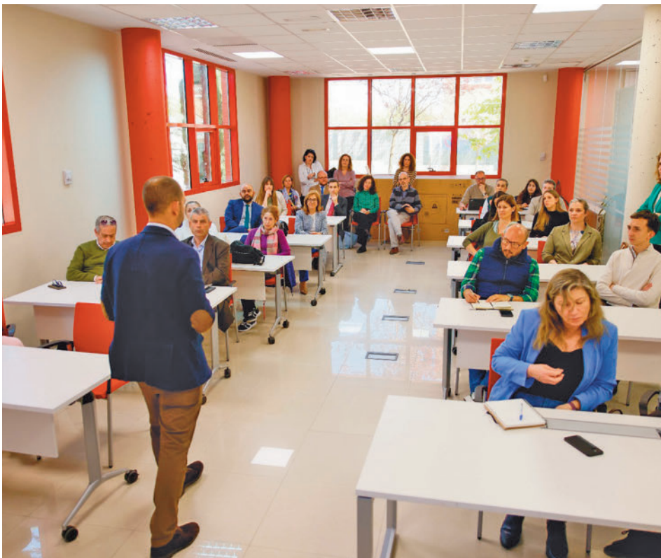
Imagen de uno de los cursos de ediciones anteriores