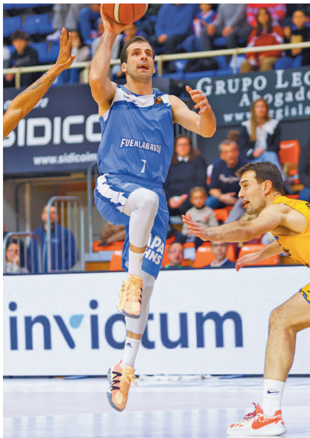
Nueva cita en el Fernando Martín ALBA PACHECO / FEB

EL EQUIPO DE TONI TEN TIENE AL REAL BETIS A TIRO DE UN SOLO TRIUNFO