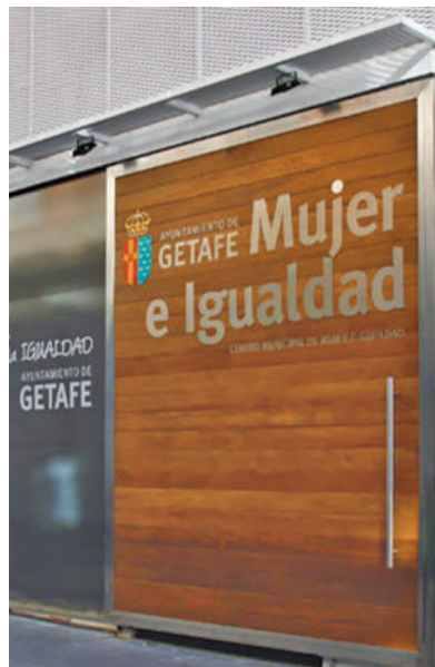
Se atenderá en el Centro de Mujer

A partir del mes de mayo, Getafe dispondrá de un servicio de prevención y detección de la violencia de género digital, 'Spying man', que llevará a cabo un Observatorio piloto. Se prestará en el Centro de la Mujer e Igualdad y ayudará a aquellas que son acosadas en redes sociales o que son víctimas de sextorsión, suplantación de identidad o de seguimientos de programas espías en disposi-