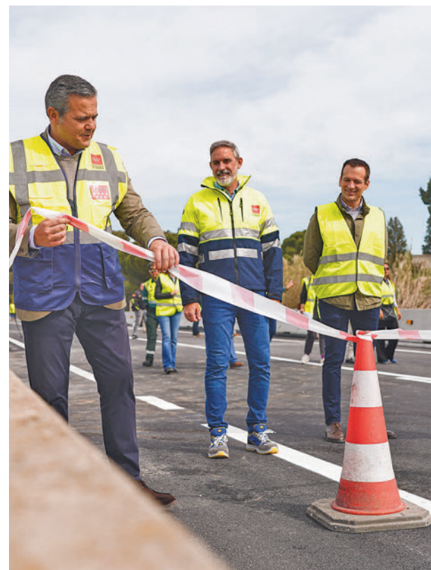
El consejero cortó la cinta para dejar paso a los vehículos

Cabe recordar que el origen del problema se remonta al pasado año cuando el pontón de 5 metros se vio gravemente afectado por la DANA de