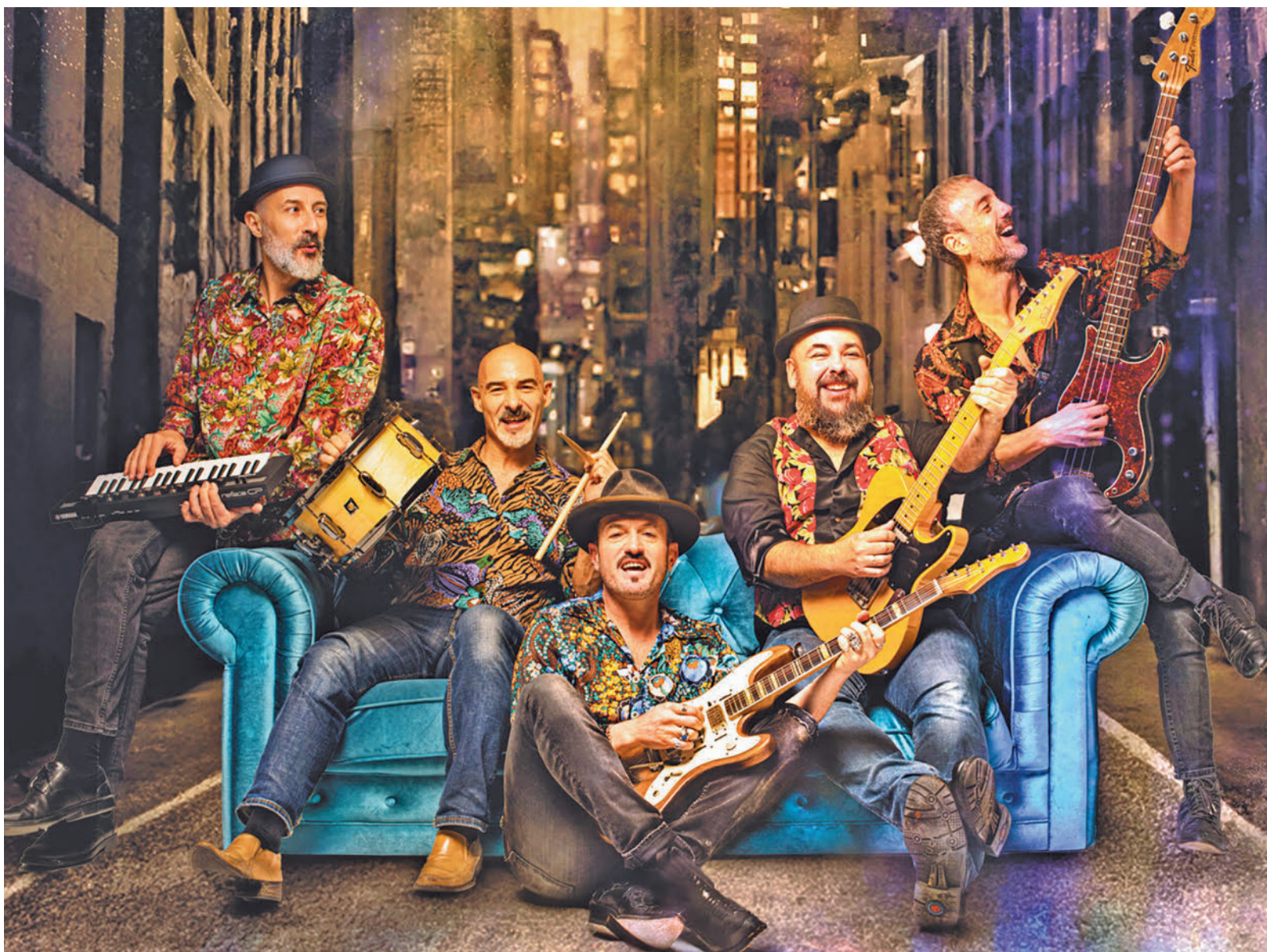
Foto promocional de la banda