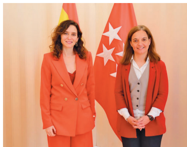
La alcaldesa señaló que es la primera reunión en 5 años

Mientras el Ejecutivo regional afirma que este año invertirá más de 45 millones de euros en la localidad, la regidora ha criticado que no haya habido "ni un solo compromiso" sobre los asuntos pendientes con Getafe. "Pero insistiremos, nuestra ciudad merece más desde la Puerta del Sol", ha dicho.