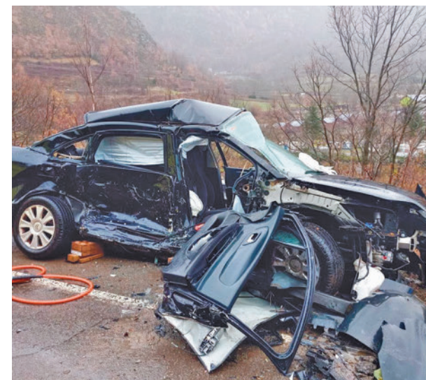
Los datos fueron peores durante el año pasado

En términos generales, y según los datos que maneja la Comisión Europea, en España entre los años 2019 y 2023 se ha reducido únicamente un 1% la tasa de víctimas mortales en siniestros de tráfico. El dato está muy lejos de otros países como Bélgica, que en dicho periodo de tiempo ha logrado una reducción del 22%, Dinamarca (20%) y Finlandia (17%).