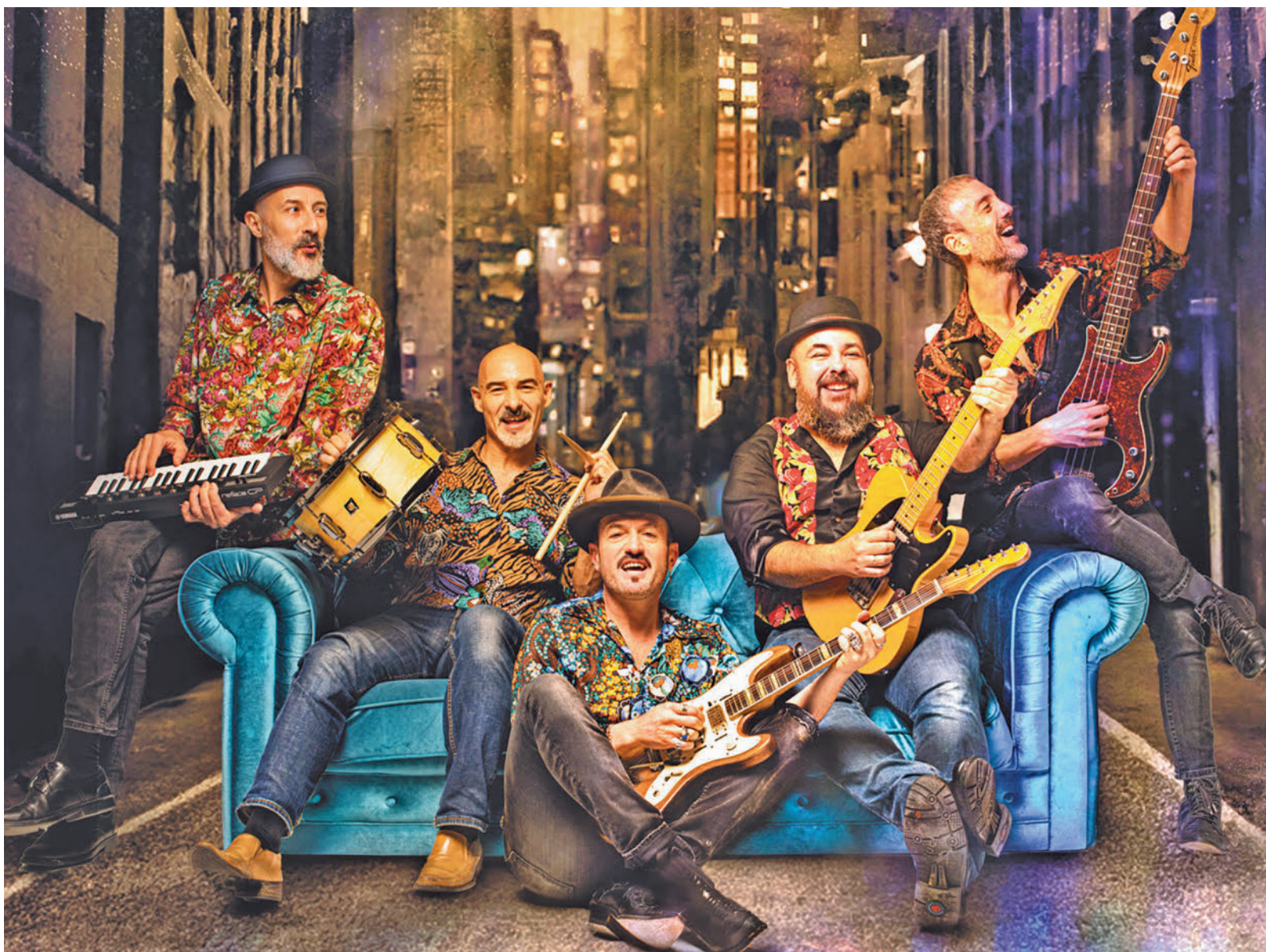
Foto promocional de la banda