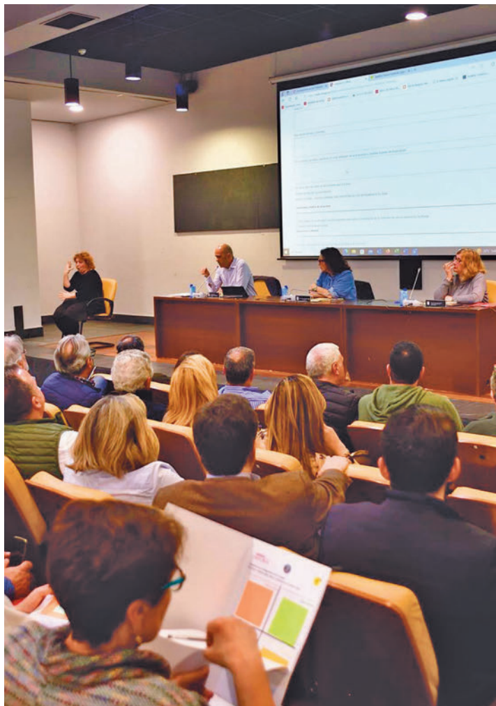
Imagen de una de las reuniones celebradas

LA PRESENTACIÓN TUVO LUGAR EL 20 DE FEBRERO, CON AFORO COMPLETO