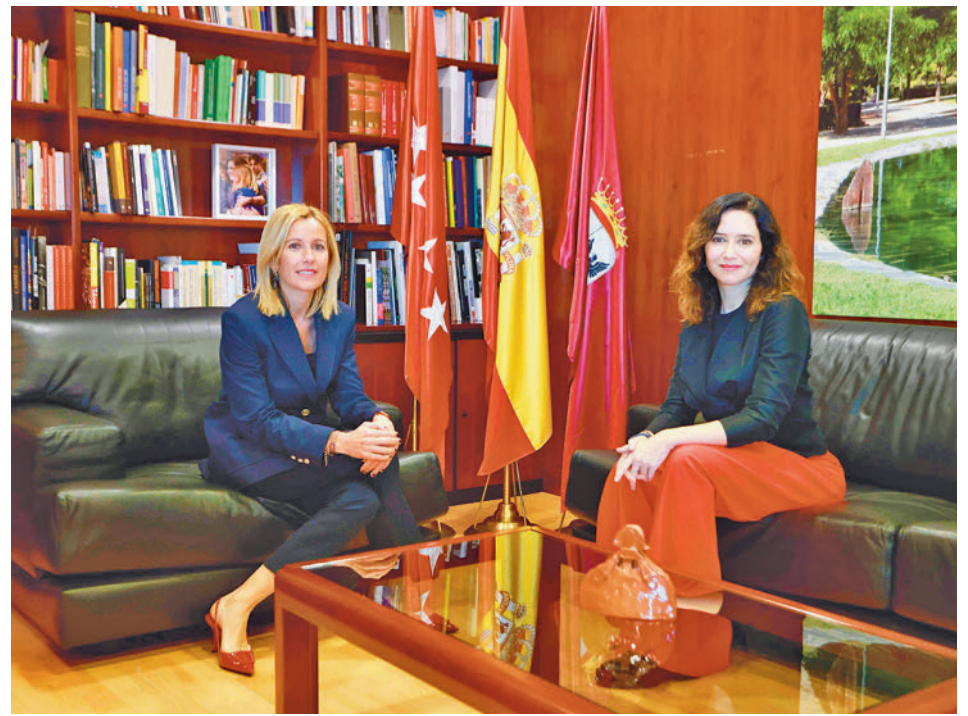
La alcaldesa y la presidenta regional, antes de la reunión del miércoles

Además, el Gobierno regional adelantó que destinará este año 636.000 euros para llevar a cabo trabajos de mejora entre los que se incluyen la climatización e impermeabilización de las fachadas de los centros de salud Arroyo de la Vega, La Chopera, Marqués de la Valdavia y Miraflores. Asimismo, Díaz Ayuso trasladó a la alcaldesa de Alcobendas su compromiso de estudiar la viabilidad de poner en marcha un nuevo centro de salud mental.