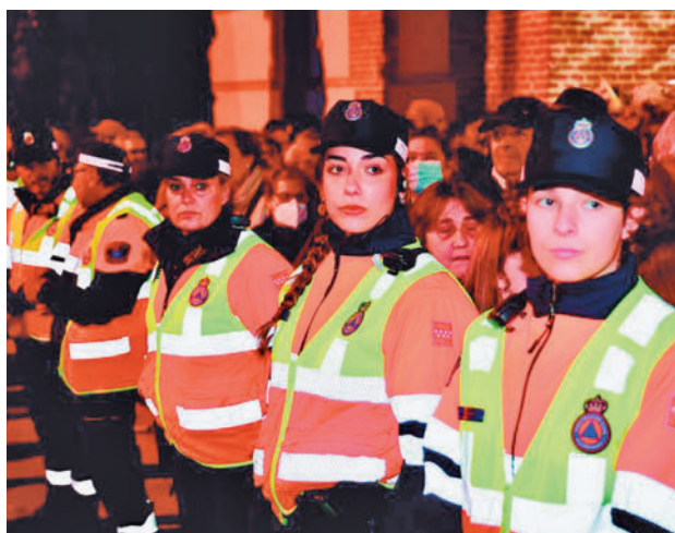
Miembros de Protección Civil

Uno de los objetivos que persigue esta iniciativa es ampliar la agrupación de voluntarios, que actualmente está formada por 110 personas, entre conductores, enfermeros, médicos, técnicos en emergencias, auxiliares y operadores de radio.