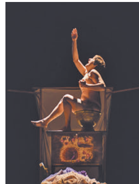
'El grito del cardo'

» Sábado 13, 19 horas. Teatro Municipal. Precio: 10 euros