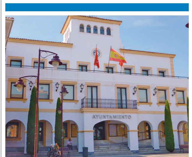
Ayuntamiento de San Sebastián de los Reyes

El Centro Joven Imagina acogerá sesiones informativas los viernes 12, 19 y 26 de abril, de 17 a 18 horas, dirigidas a los niños y adolescentes de la ciudad para informarles del funcionamiento de los consejos, sus funciones y derechos o el compromiso de asistencia a las sesiones que se convoquen en caso de conseguir formar parte de ellos. Los requisitos son tener una edad comprendida entre los 8 y los 16 años, y vivir o estudiar en el municipio de Alcobendas.