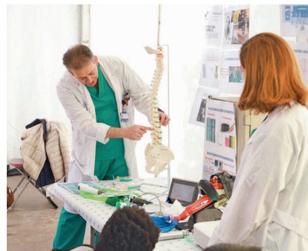
Una de las charlas llevadas a cabo estos días

El Ayuntamiento agradece la participación y recalca que "todas las ideas y propuestas aportadas se estudiarán y se tendrán en cuenta para su posible incorporación".