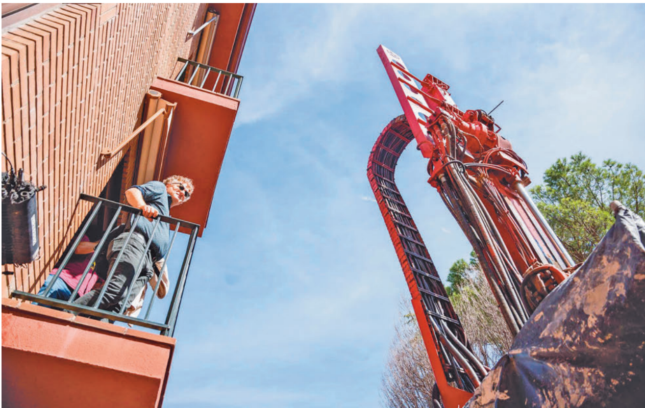
Obras en las inmediaciones de los edificios afectados por la Línea 7B