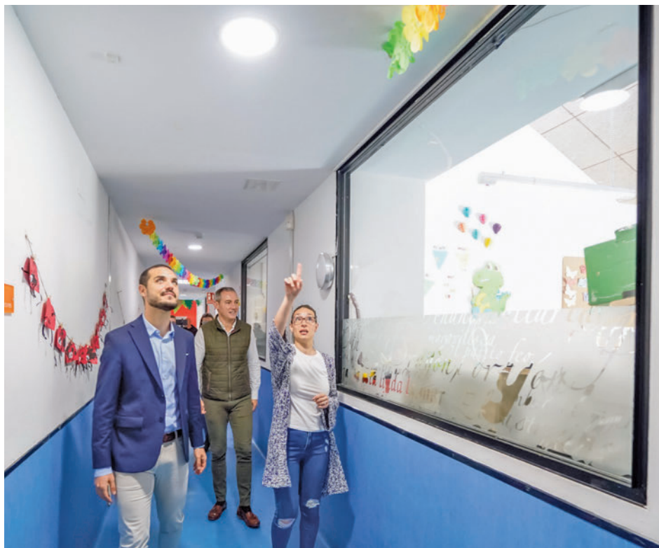
Visita del alcalde de Torrejón al centro educativo

El proyecto ha consistido en montar, sobre la cubierta plana actual, una sobrecubierta metálica de chapa, con las caídas correspondientes, empleando las estructuras metálicas auxiliares necesarias para su apoyo. También se han montado canalones y nuevas bajantes que recogerán las aguas de la nueva cubierta. Con estas obras se han eliminado las goteras que se producían en el interior del centro, tanto en aulas, pasillos y despachos. Además, se han pintado los techos y paredes de las aulas y pasillos que estaban afectadas por las humedades. Estas mejoras se han llevado a cabo sin afectar