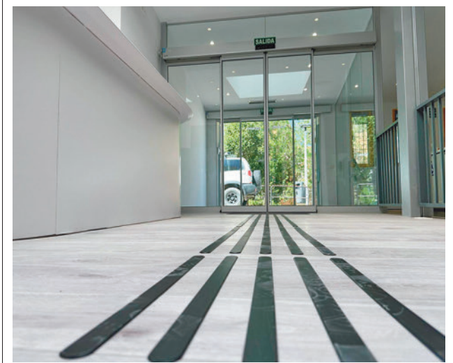
Nuevo aspecto del centro

Toda la actualidad de la zona Este, en nuestra página web