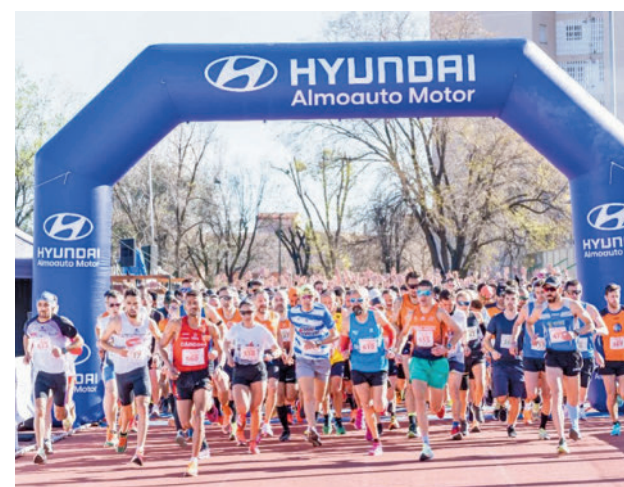
Pasada edición de la Media Maratón

Con motivo de esta prueba deportiva, la Policía Local de Coslada activará un dispositivo especial de tráfico y seguridad, que provocará afecciones y cortes de tráfico entre las 9:30 y las 12:30 horas. Se podrá circular por la avenida