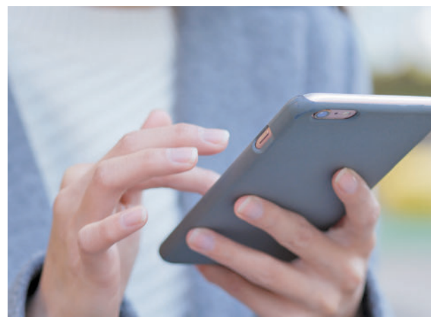
El abono telemático simplifica el trámite con la administración

La actualidad de los municipios del Noroeste, en nuestra web.