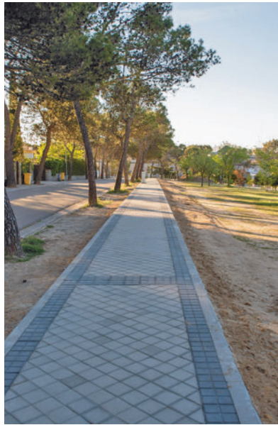
Una de las aceras renovadas

El Consistorio de Boadilla del Monte ha finalizado las actuaciones incluidas en el Plan de Acerado de las Urbanizaciones Históricas, que ha supuesto la inversión de 1,49 millones de euros, cofinanciados con Fondos del Plan de Inversión de la Comunidad de Madrid. La última calle en la que se ha trabajado ha sido Valle del Roncal, en Las Lomas. Las otras incluidas han sido las siguientes: Mon-