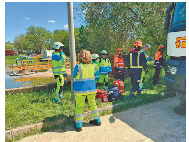
Lugar en el que se produjo el suceso

También se desplazó hasta allí la psicóloga de guardia del Summa 112 para atender a los compañeros del operario fallecido, que se encontraban muy afectados. Agentes de la Guardia Civil se personaron en el lugar y se hicieron cargo de las investigaciones para conocer las causas del suceso.