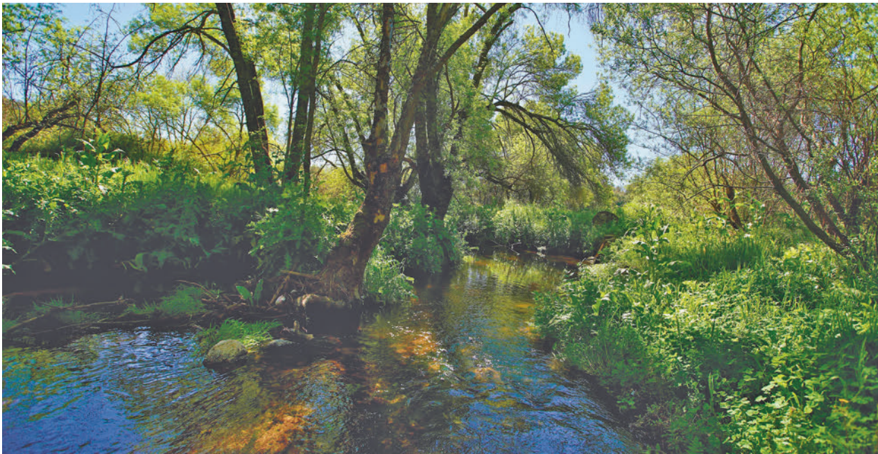
El arroyo Trofa, a su paso por Las Rozas