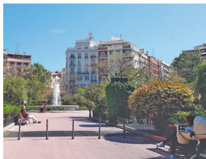
Puerta del Sol y Plaza de Olavide: Para realizar el estudio, los investigadores hicieron 750 entrevistas a vecinos y otras 38 a comerciantes de dos zonas peatonalizadas del centro de Madrid: los entornos de la Puerta del Sol y de la Plaza de Olavide, ambas en el distrito Centro.

“Peatonalizar es beneficioso para la salud, el medio ambiente, la movilidad e incluso la economía, sin embargo, a menudo hay gran oposición ciudadana a este tipo de medidas. Esto dificulta su implementación, más aún cuando son de gran alcance y per-