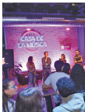
Ocio para este viernes

vada Casa de la Música. Este viernes, a partir de las 19 horas el cantautor, compositor y músico Guiu Cortés, conocido artísticamente como El Niño de la Hipoteca, se subirá al escenario "para dar a conocer su música y sus letras, en las que mezcla el humor y las reivindicaciones so-