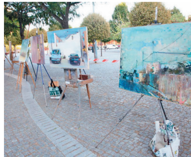
La muestra estará abierta al público hasta el 19 de mayo

La muestra estará abierta al público en horario de 17 a 21 horas todos los viernes y vísperas de festivos. En el caso de los sábados y domingos, además de festivos, podrá verse de 11 a 14 horas y de 17 a 21 horas.