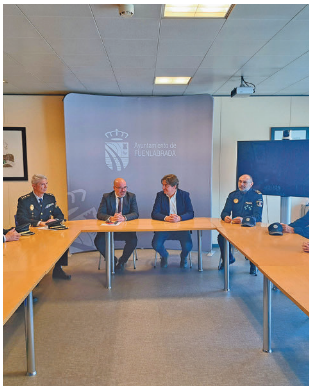
Los que más bajan son los delitos de robos con fuerza