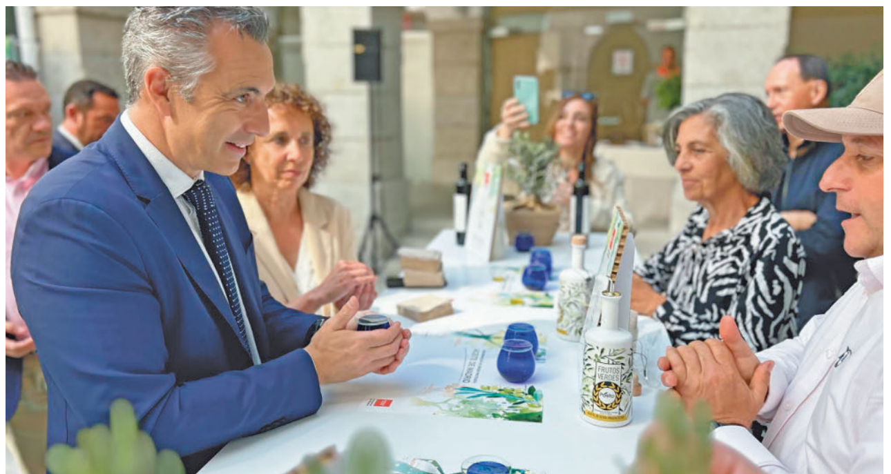
Presentación del nuevo sello para el aceite madrileño

Hectáreas De olivar son los que tiene en el actualidad la Comunidad de Madrid