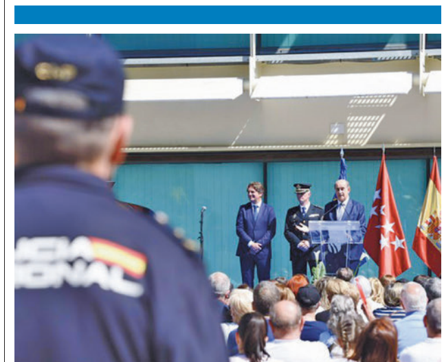
El Cuerpo lleva en Fuenlabrada desde 1985 POLICÍA NACIONAL

La campaña se centra en tres actuaciones: revisar la señalización informativa sobre la velocidad a la que se puede circular en todo el municipio, realizar controles y, por último, extraer datos de los radares. Con ello se realizará un estudio para valorar la instalación de elementos que mejoren el tráfico rodado.