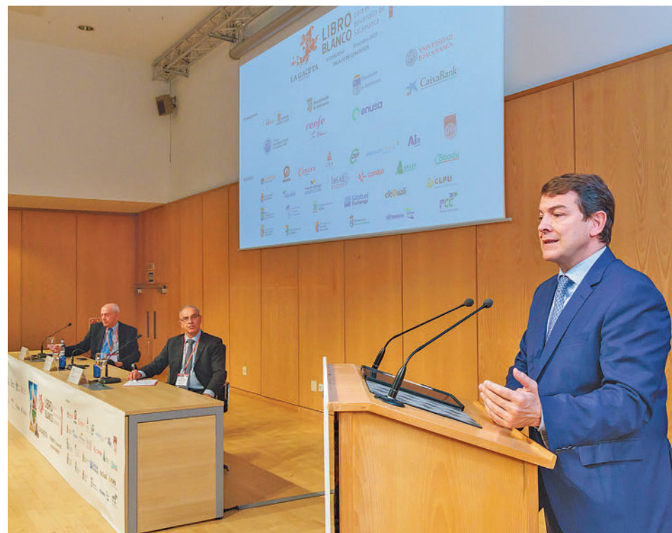
Fernández Mañueco, durante el acto celebrado en Salamanca

El presidente regional, Alfonso Fernández Mañueco, anunció que el Hospital de Salamanca contará con una tecnología que ayuda a mejorar el porcentaje de éxito contra esta enfermedad