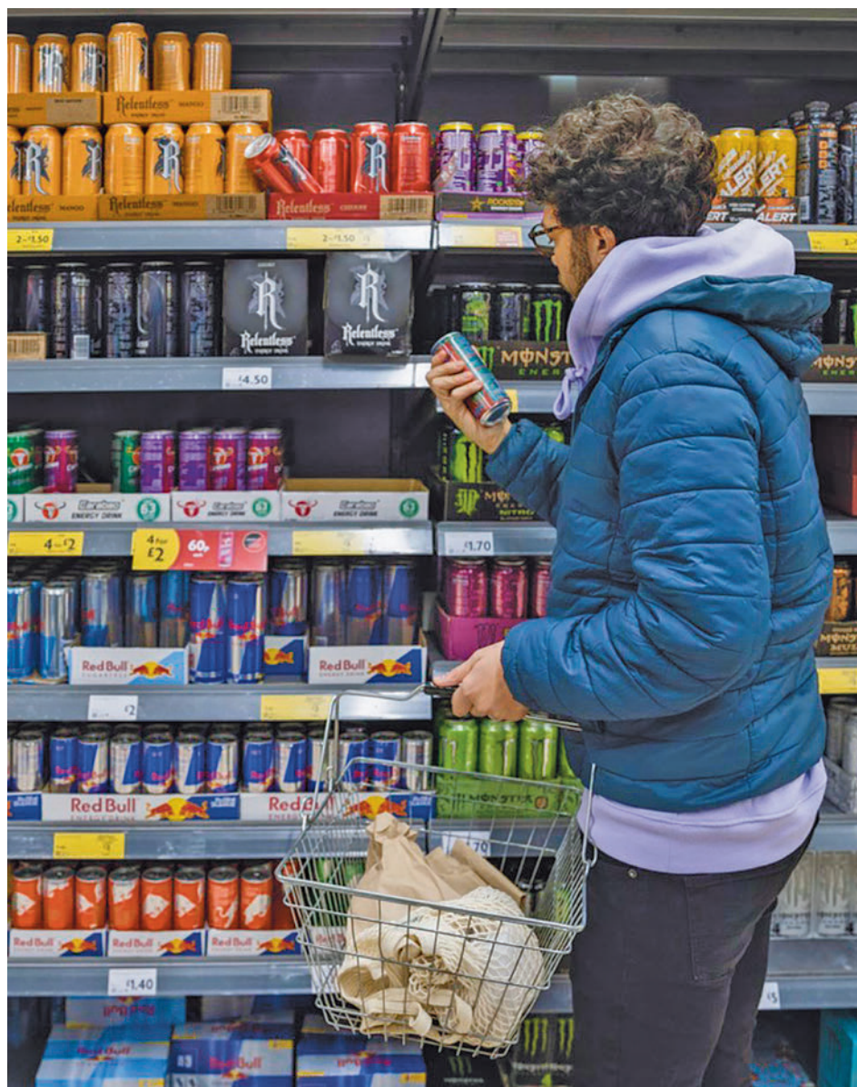
Un joven compra bebidas energéticas

Además, resalta que este tipo de bebidas "no deben combinarse con bebidas alcohólicas" ya que "el consumo de alcohol mezclado o en combinación con bebidas energéticas conduce a estados subjetivos alterados que, entre