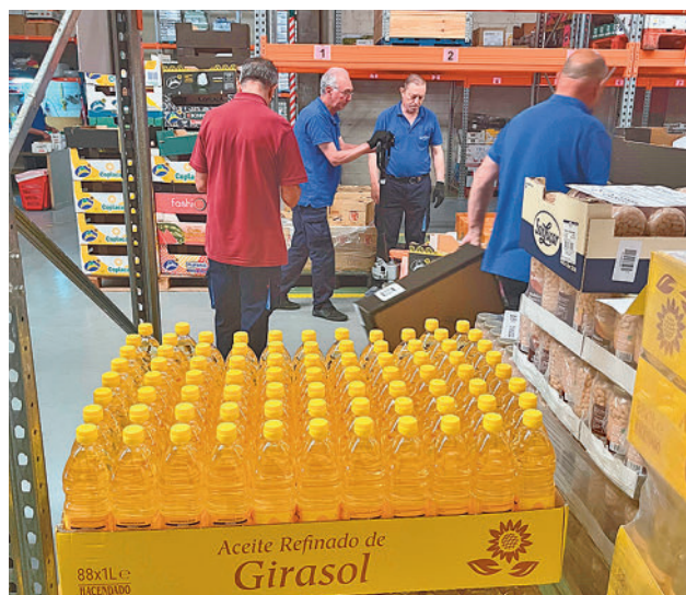
Los productos no perecederos son la base de estas campañas