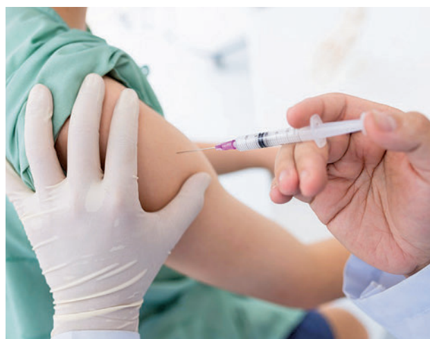
Se podrá conocer el avance de la vacunación

zar "amplios porcentajes" de cobertura entre la población y "recordar a la ciudadanía la importancia de las vacunas como medida preventiva para garantizar la salud pública". El plan que se activa convierte a las farmacias "en red de vigilancia y promoción" de la vacunación e incluye varias estrategias de trabajo por parte de los farmacéuticos de la Comunidad.