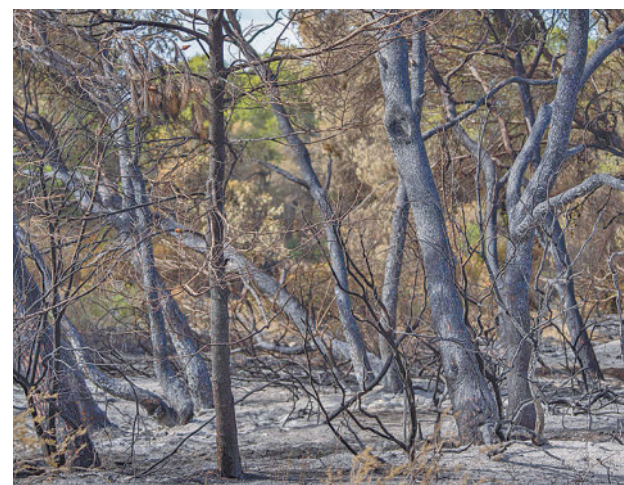
Superficie quemada en España este año

En cuanto al tipo de siniestro, en el periodo analizado se han registrado 7.141 fuegos, de los que su mayoría,