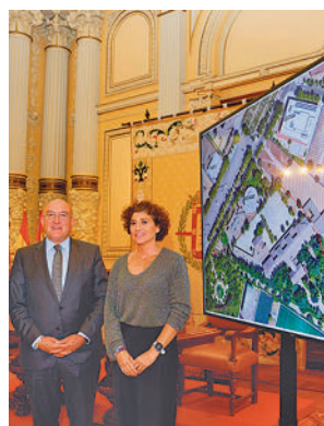
Un momento de la reunión

Se va a estudiar la posibilidad de que cuente con unas dimensiones de 45 metros de largo por 30 metros de ancho donde se puedan instalar, en