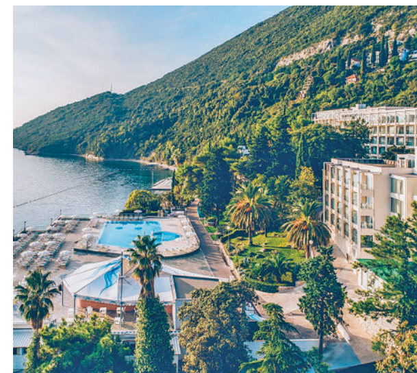
El turismo ha crecido este año

Respecto al incremento de la turismofobia, Morillo considera que cada territorio debe conseguir encontrar el equilibrio que mejor se ajuste en función de sus características entre los turistas y los residentes.