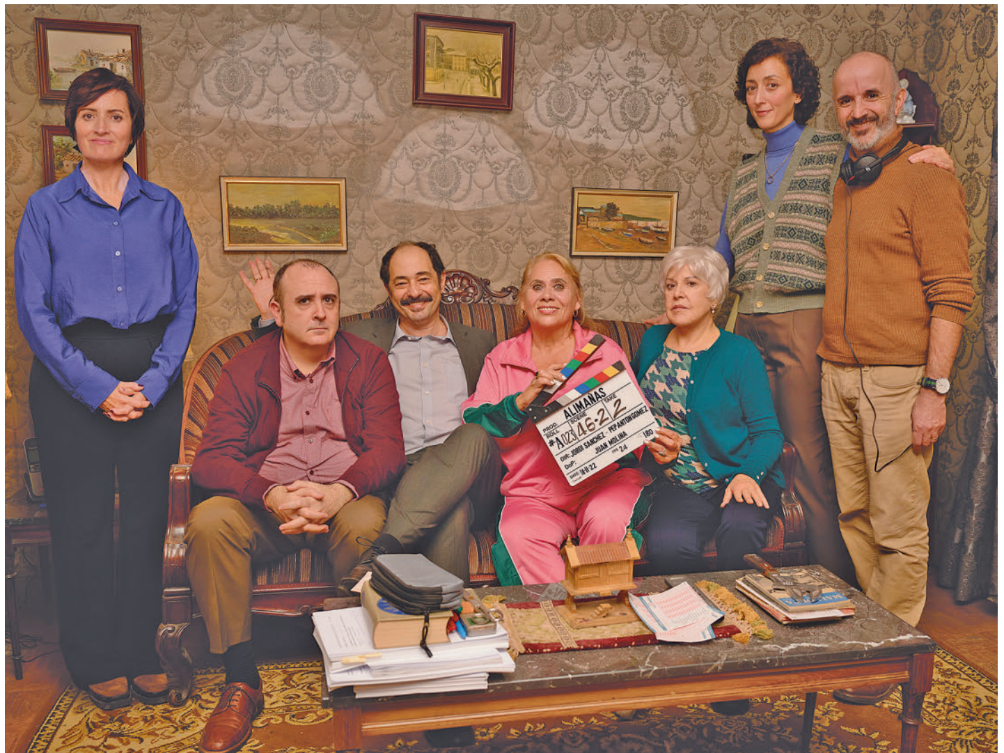
Foto de familia del elenco durante el rodaje

— Jordi Sánchez: No, porque la obra tiene 400 años (entre risas). La escribimos hace 20 años, por lo que el elenco en ese momento no lo teníamos en la cabeza. A las vecinas las incorporamos cuando hicimos el guion cinematográfico, porque en la obra de teatro original no existían. De lo que estamos muy contentos es que nos dijeran sí a la primera, estamos muy sorprendidos y agradecidos por el elenco que es.