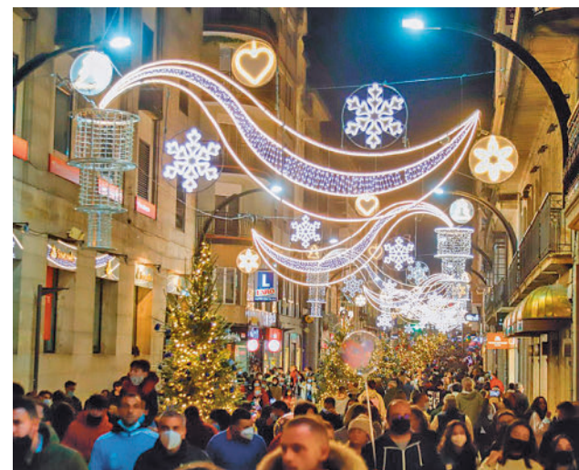
Madrid es el destino favorito en diciembre

El actor Jordi Sánchez debuta como director junto a Pep Antón Gómez de la mano de la comedia 'Alimañas', que llega a las salas el viernes 27