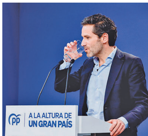
El portavoz del PP, Borja Sémper

EL PERIÓDICO GENTE NO SE RESPONSABILIZA NI SE IDENTIFICA CON LAS OPINIONES QUE SUS LECTORES Y COLABORADORES EXPONGAN EN SUS CARTAS Y ARTÍCULOS