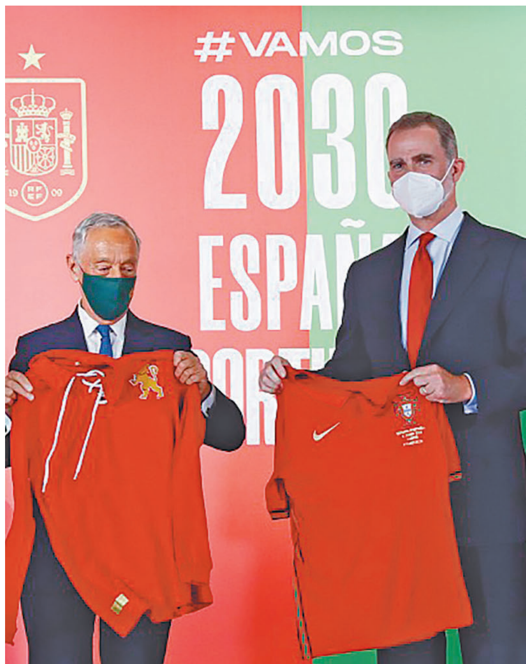
Presentación oficial de la candidatura inicial de España y Portugal

En lo que respecta a los estadios españoles, Madrid ofrecería dos, el Santiago Bernabéu, que ya acogió la final del Mundial de 1982 y cuya remodelación estará acabada en 2024; y el Metropolitano, que se convirtió en casa del Atlético de Madrid en 2017, contando ya en su haber con una final de Champions League, la de 2019. Otro de los estadios que está en