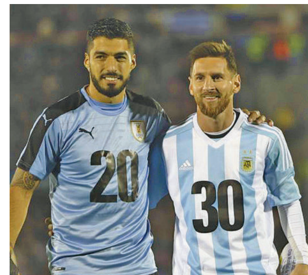
Suárez y Messi promocionaron la candidatura

Esta decisión salomónica ha dejado un gran damnificado por el camino. Chile formaba parte de la candidatura conjunta que presentaron cuatro países sudamericanos, pero es la única que finalmente se quedará sin albergar un solo encuentro de esta edición.